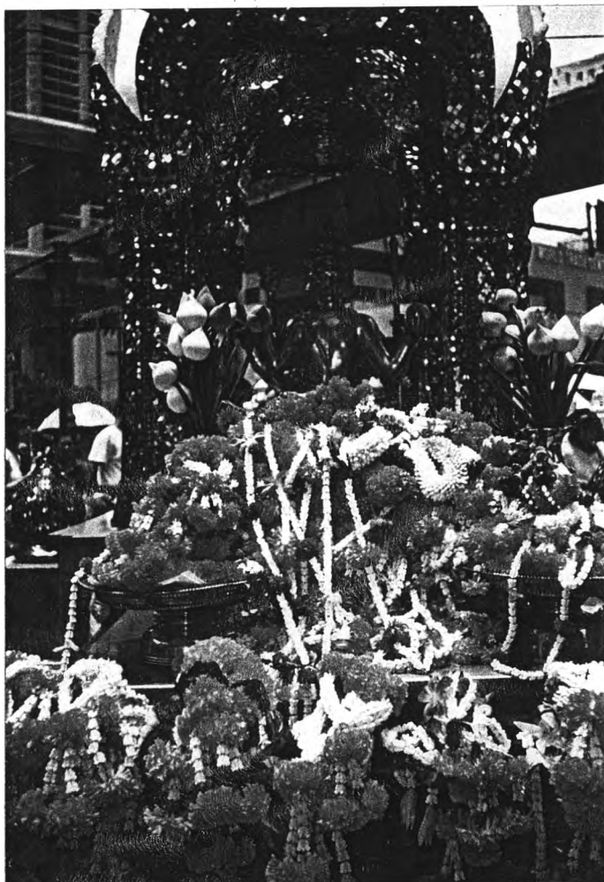
ศาลพระพรหม โรงแรมเอราวัณ