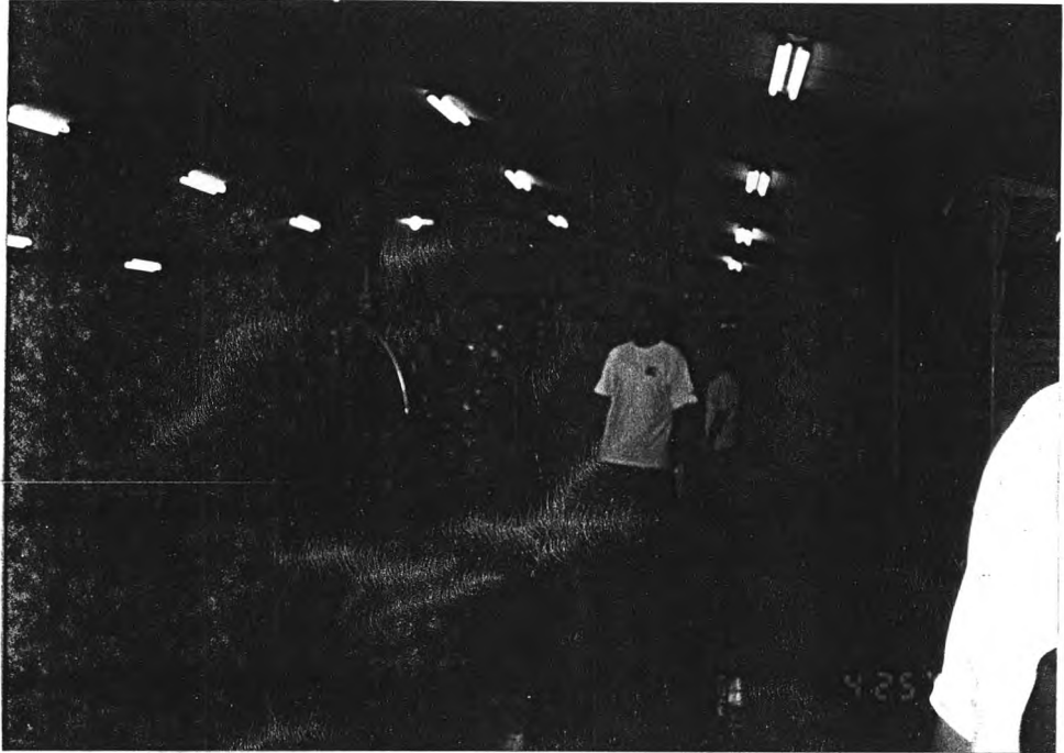
ที่ประดิษฐาน พระพุทธรูป หลวงพ่อโสธร