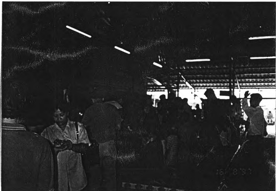
บริเวณด้านนอกที่ประดิษฐานพระพุทธรูป ใช้เป็นสถานที่ สำหรับประชาชนมากราบไหว้ขอพร