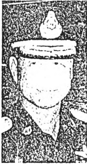
พลจัตวาอ้อด เทอร์โบ

คน การสอนเข้าเป็นผู้กุมหรือคุมขังถึง 3 พัน สองหมื่น ซึ่งมากมาจากผู้สมัครสอบที่ปีประมาณ 15,000 คน สอบผ่านแล้วประมาณ 512 คน จึงจะได้ออกไปรับนักโทษ แต่ทุกปีก็จะมี ทั้งที่เป็นนักโทษจำนวนมาก เพราะนักโทษที่ไปไม่ได้ เป็นสื่อนใหม่ก็เพื่อลงโทษปรับรวมแล้วรวม มาปล่อยใหม่ก็มี ลอนที่ผู้กุมหญิงร้องเจ้า พนักงานก็มากขึ้น เพราะนักโทษก็มากขึ้น แต่ข้อ กล่าวถึงของเจ้าพนักงานไม่มีการแก้ไขเลย แล้ว นี่ก็มีข่าวออกมาอีกว่าเมืองฉังชือที่นักวิชาชีพ ความปลอดภัยก็จะโดนไล่ต่อไปอีก ข้าราชการ ผู้กุมไม่เพิ่มอีกแล้วเหมือนกัน ที่ผู้กุมหญิง ส่วนนี้ก็ออกไปผู้กุมหรือคุมขังแล้วเรื่องอื่นๆ