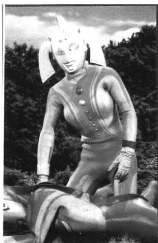
ภาพที่ 4.9 ภาพเจ้าแม่อุลตราช่วยเหลืออุลตราแมนทาโร

โดยผู้วิจัยเห็นว่าที่เด็กปฐมวัยนั้นสามารถถอดรหัสภาพตัวแทนจากบทบาทของนางเอกดังกล่าวออกมาได้นั้นเป็นเพราะเนื้อหาที่นำเสนอ ในเรื่อง อุลตราแมน แม้ว่าเด็กปฐมวัยจะไม่รู้ถึงลักษณะวัฒนธรรม ค่านิยมของสังคมญี่ปุ่น แต่ทว่าเด็กปฐมวัยก็สามารถเข้าใจสิ่งที่นำเสนอออกมาได้ เนื่องจากเด็กปฐมวัยสามารถรับชมจากการสื่อสารเชิงความเสมือน (Analogical Message Code) คือภาพเรื่องราวที่แสดงถึงความเป็นผู้ช่วยเหลือของเจ้าแม่อุลตรา ภาพที่ 4.9 ที่ถ่ายทอดออกมาจาก เรื่อง อุลตราแมน ซึ่งได้ผสมผสานเข้ากับการสื่อสารเชิงตรรกะ (Digital Message Code) ซึ่งก็คือเนื้อหาต่างๆที่กำหนดบทบาทของเจ้าแม่อุลตราที่ถูกนำเสนอในเรื่อง อุลตราแมนนั่นเอง