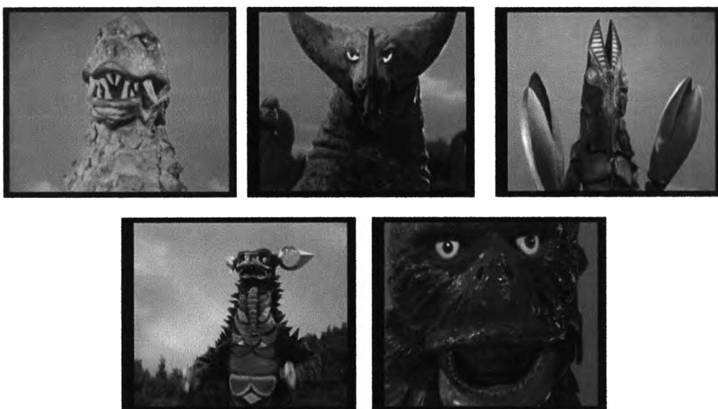
ภาพที่ 4.10 ภาพสัตว์ประหลาดที่มีหน้าตาน่าเกลียด น่ากลัว

เด็กปฐมวัยสามารถถอดรหัสสิ่งเหล่านี้ได้ซึ่งผู้วิจัยเห็นว่า เป็นเพราะการนำเสนอของเรื่องอุลตราแมนที่นำเสนอเรื่องราวของสัตว์ประหลาดออกมาเป็นตัวร้ายที่มักจะทำลายล้างบ้านเมือง ซึ่งในการนำเสนอนั้นก็มีการนำเสนอในส่วนของ การสื่อสารเชิงตรรกะ (Digital Message Code) ที่กำหนดเรื่องราวในเรื่อง อุลตราแมน รวมทั้งบทบาทของสัตว์ประหลาดที่มีบทบาทในการทำลายบ้านเมือง และทำร้ายผู้คน และรวมถึงการสื่อสารเชิงภาพเสมือน (Analogical Message Code) ที่นำเสนอภาพของอุลตราแมนที่มีหน้าตาน่าเกลียด ดังภาพที่ 4.10 และมักจะทำลายบ้านเมือง ทำร้ายผู้คน ซึ่งปรากฏในเกือบทุกตอน ดังภาพที่ 4.11