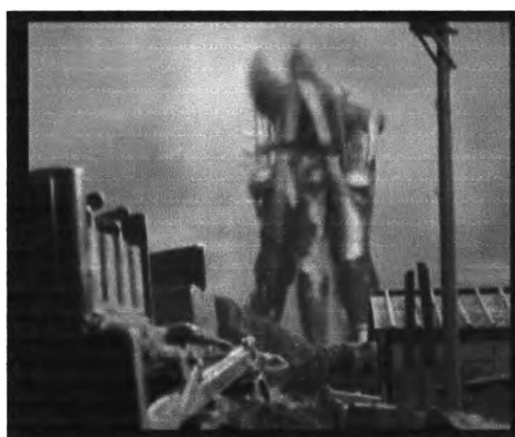
ภาพที่ 4.8 ภาพแสดงการรวมพลังของเหล่าอุลตรา (2)แมน ในการต่อสู้กับสัตว์ประหลาด