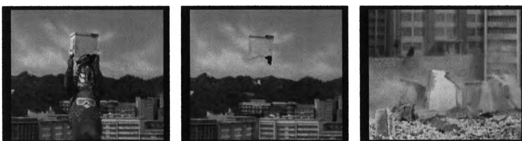
ภาพที่ 4.11 ภาพสัตว์ประหลาดทำลายบ้านเมือง