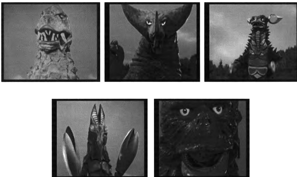
ภาพที่ 4.4 ภาพสัตว์ประหลาด