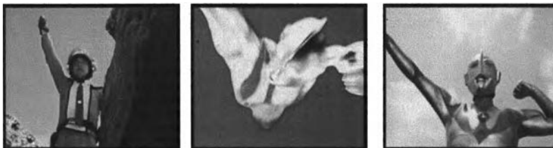
ภาพที่ 4.5 ภาพการแปลงร่างของฮายาตะเป็นอุลตราแมน

ในทุกตอนของ เรื่อง อุลตราแมนนั้นล้วนมีการการแสดงให้เห็นถึงการแปลงร่างของคนธรรมดาในหน่วยกู้ภัย กลายเป็นอุลตราแมนมาต่อสู้กับสัตว์ประหลาดได้ทั้งสิ้น ดังภาพที่ 4.5