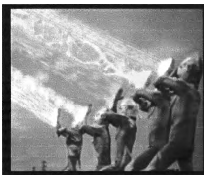
ภาพที่ 4.7 ภาพแสดงการรวมพลังของเหล่าอุลตรา (1)แมน ในการต่อสู้กับสัตว์ประหลาด

นอกจากนี้ยังมีตอน ศึกยอดมนุษย์ 5 พลัง ที่เป็นการ ต่อสู้ของอุลตราแมนรวมพลังกัน เพื่อต่อสู้กับสัตว์ประหลาดที่ อุลตราแมนเพียงตัวเดียวไม่สามารถสู้ได้ ดังเช่น ภาพที่ 4.7 และ 4.8 จากเรื่อง อุลตราแมน ตอน ศึกยอดมนุษย์ 5 พลัง