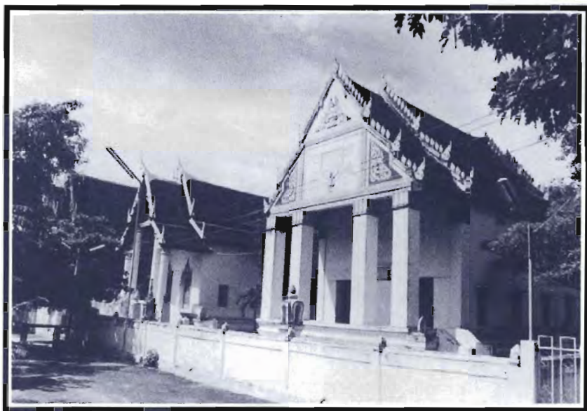
พระอุโบสถ และวิหาร วัดมณีเสถิตกปิฏฐารามวรวิหาร