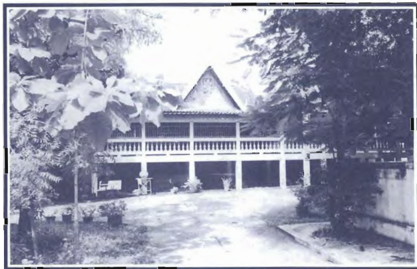
ภูมิตุนทรประมุข