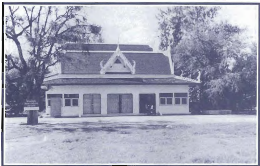
ศาลาเอนกประสงค์