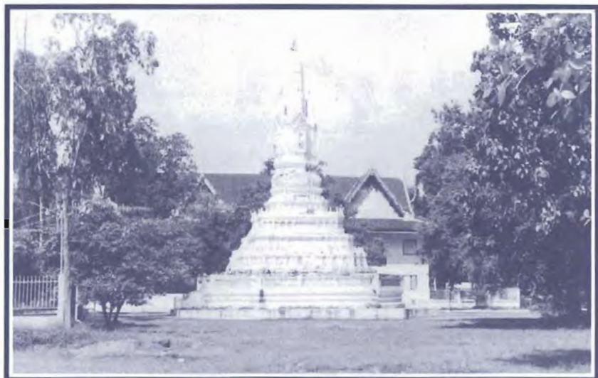
พระเจดีย์