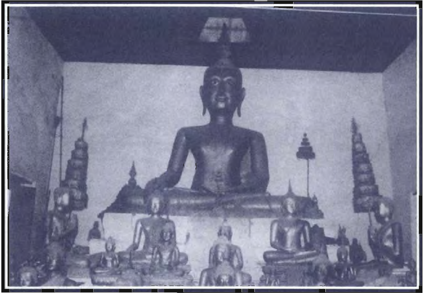
พระประธานอุโบสถ วัดมณีสถิตกปิฏฐารามวรวิหาร