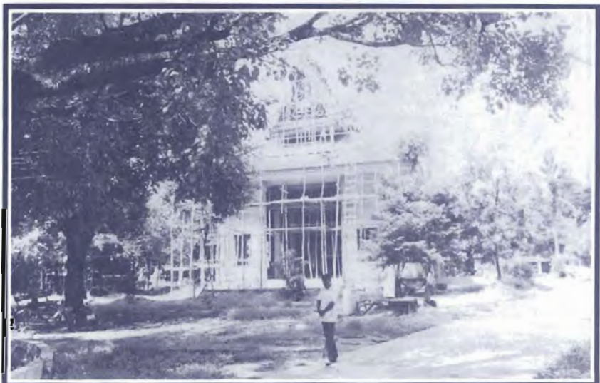
วิหารเพื่อจะประดิษฐานหลวงพ่อชิต