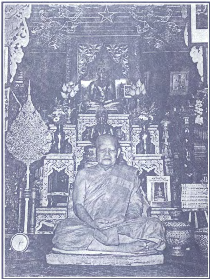
พระราชอุทัยกรී สุธตตเถระ (พุม) อดีตเจ้าอาวาสวัดมณีสถิตกปิฏฐาราม