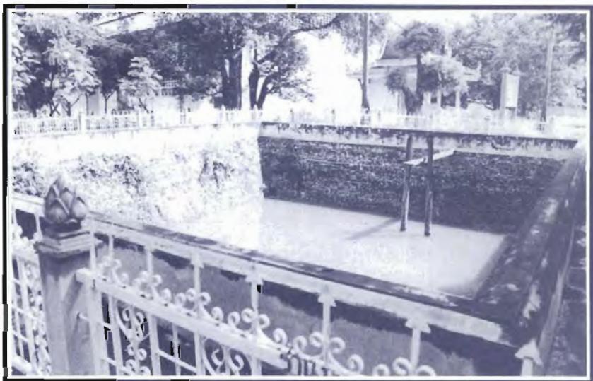
สระน้ำมนต์ศักดิ์สิทธิ์