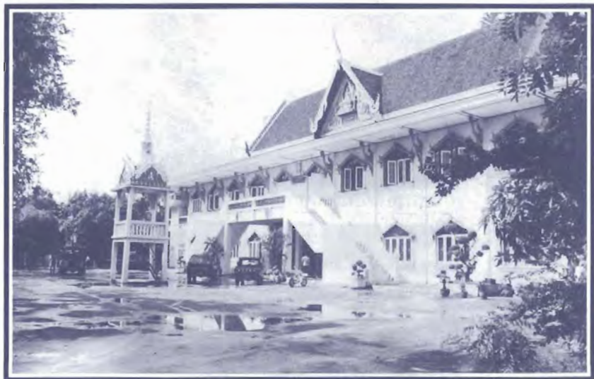
ศาลาสังฆสภา