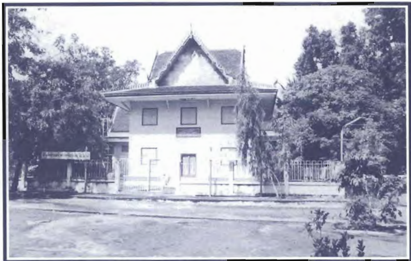
สำนักงานเจ้าคณะจังหวัดอุทัยธานี