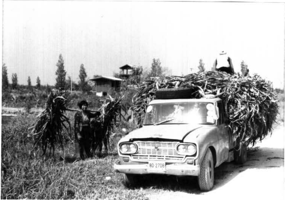
รูป 4.8 คนจากฟาร์มโคนมมาตัดต้นข้าวโพดเก่า