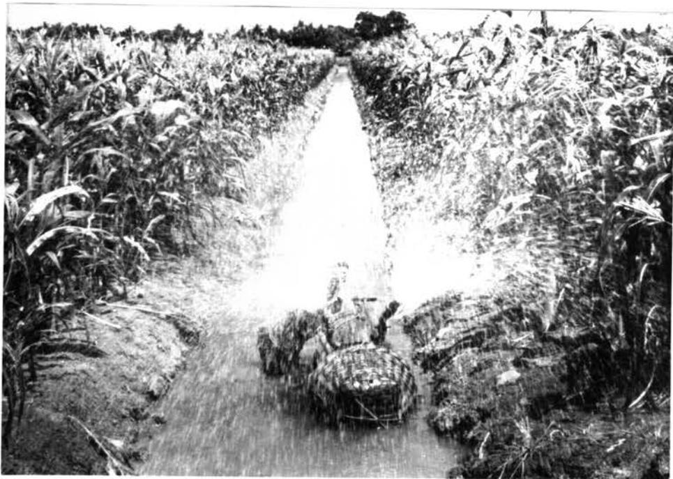
รูป 4.4 การรดน้ำด้วยเครื่องยนต์