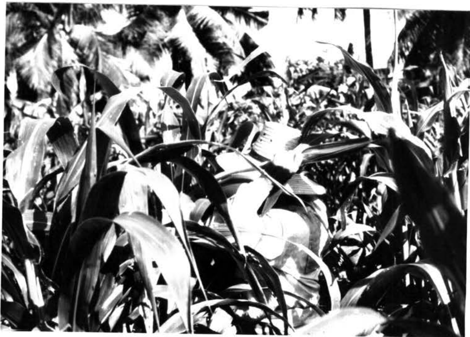
รูป 4.5 การค้ำช่อดอกตัวผู้