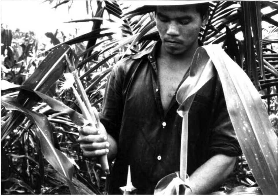
รูป 4.7 การเก็บผัก