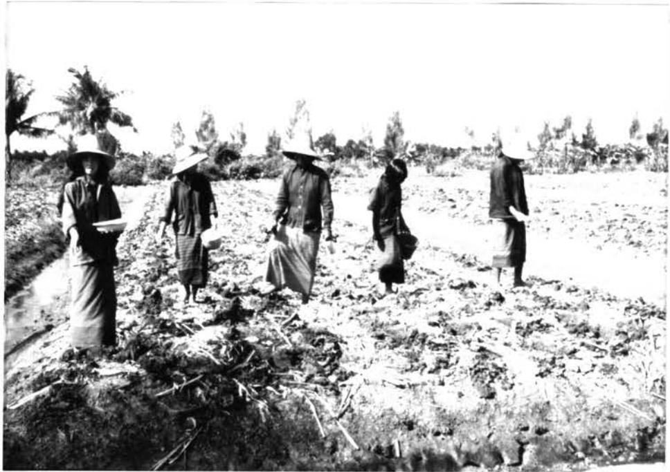
รูป 4.3 การหยอดเมล็ดและกลบดิน