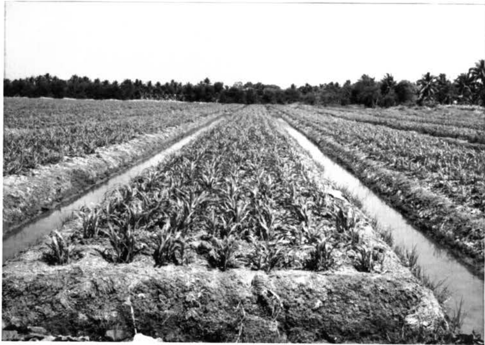
รูป 4.1 ลักษณะร่องปลูกแบบยกร่องสวน