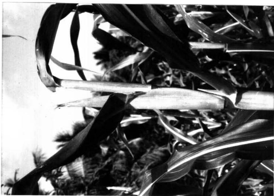
รูป 4.6 ลักษณะฝักที่สามารถเก็บได้