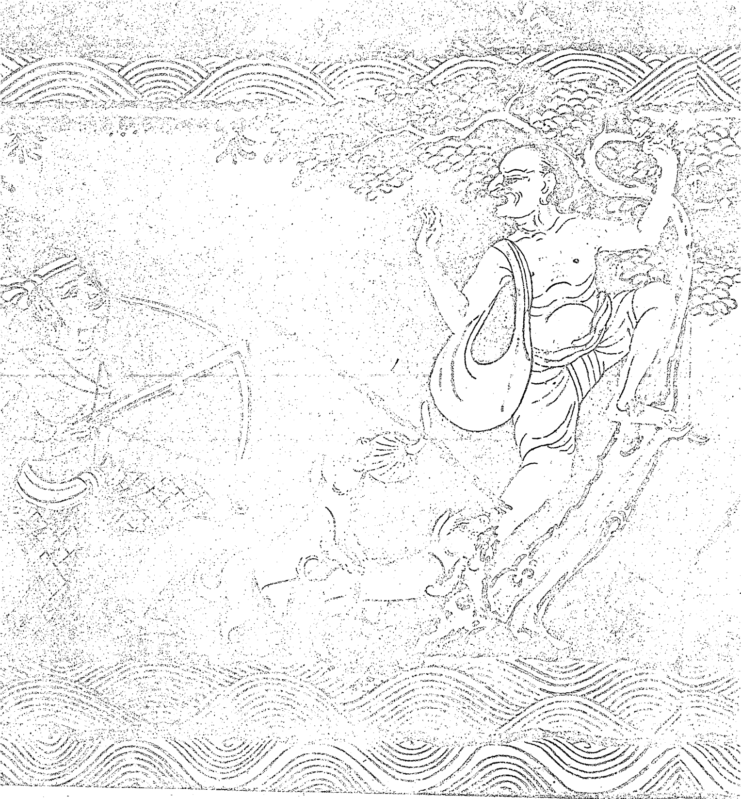
XX. DIE VERFOLGUNG DES CHŪCHOK