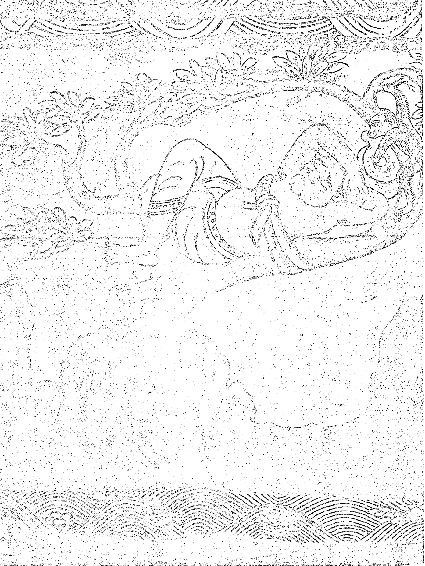
XVIII. DER SCHLAFENDE CHÜCHOK