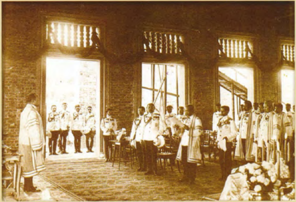
สมเด็จพระเจ้าบรมวงศ์เธอ กรมพระยาดำรงราชานุภาพ นายกสภากรรมการจัดการโรงเรียนข้าราชการพลเรือนฯ กราบบังคมทูลถวายรายงานในพระราชพิธีก่อพระฤกษ์โรงเรียนข้าราชการพลเรือนฯ