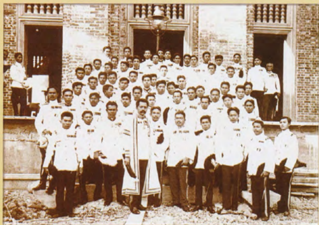
อาจารย์และนักเรียนเก่าโรงเรียนข้าราชการพลเรือนฯ ที่เข้าร่วมในพิธีวางศิลาพระฤกษ์ เมื่อวันที่ ๓ มกราคม ๒๔๕๘