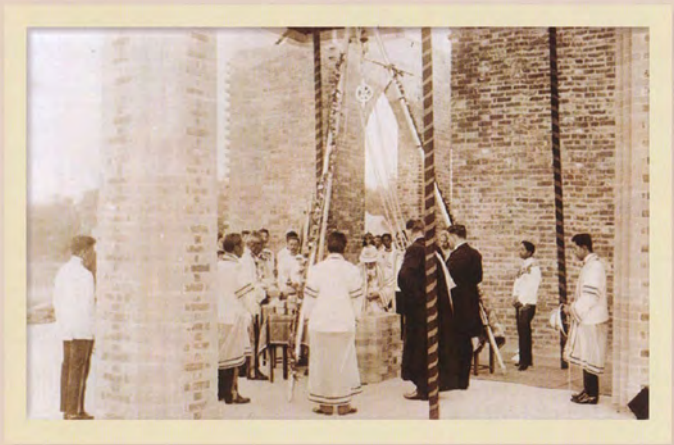
พระบาทสมเด็จพระมงกุฎเกล้าเจ้าอยู่หัว ทรงวางศิลาพระฤกษ์ ตึกบัญชาการโรงเรียนข้าราชการพลเรือนฯ (อาคารมหาจุฬาลงกรณ์ในปัจจุบัน)