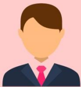
อธิการบดี

ผลการประเมินผลการปฏิบัติงานขององค์กรกำกับดูแล 11 องค์กรในรูปคณะกรรมการ 11 ชุด มีองค์กรที่ได้รับคะแนนระหว่าง 4.01 – 4.83 อยู่ในระดับ “ดีมาก” ถึง “ดีเยี่ยม” จำนวน 10 องค์กร และองค์กรที่ได้รับคะแนนระหว่าง 3.50 - 3.99 ซึ่งในระดับ “ดี” ถึง “ดีมาก” จำนวน 1 องค์กร