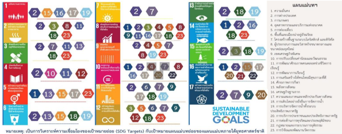
ภาพที่ 1 ความเชื่อมโยงของเป้าหมายการพัฒนาที่ยั่งยืน (SDGs) กับแผนแม่บทภายใต้ยุทธศาสตร์ชาติ (สำนักงานสภาพัฒนาการเศรษฐกิจและสังคมแห่งชาติ, 2564b)

หมายเหตุ: เป็นการวิเคราะห์ความเชื่อมโยงของเป้าหมายย่อย (SDG Targets) กับเป้าหมายแผนแม่บทย่อยของแผนแม่บทภายใต้ยุทธศาสตร์ชาติ โดยการดำเนินการเพื่อบรรลุเป้าหมายของแผนแม่บทฯ จะสัมพันธ์กับเป้าหมายของยุทธศาสตร์ชาติ และสอดคล้องกับ SDGs ด้วย (แผนแม่บทที่ไฮไลท์แสดงถึงความสัมพันธ์ทางอ้อม) สถานะ ณ วันที่ 17 ก.ค. 2563