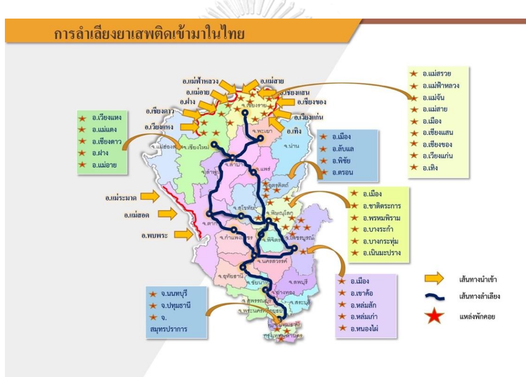
ภาพประกอบที่ 2 แสดงเส้นทางการลำเลียงยาเสพติด จากกองบัญชาการตำรวจ ปราบปรามยาเสพติด

นำเข้าลาวก่อนลักลอบเข้าไทย ส่งผลให้พื้นที่ชายแดนที่ติดกับลาว ตั้งแต่พื้นที่อำเภอเวียงแก่น อำเภอเทิง จังหวัดเชียงราย และอำเภอภูซาง อำเภอเชียงคำ จังหวัดพะเยา ต่อเนื่องไปตลอดถึงชายแดน ภาคตะวันออกเฉียงเหนือ (จังหวัดเลย จังหวัดหนองคาย จังหวัดบึงกาฬ จังหวัดนครพนม) มีการลักลอบนำเข้ายาเสพติดเพิ่มขึ้น (สำนักงานป้องกันและปราบปรามยาเสพติด, 2564) บางส่วนพักพิงในบริเวณพื้นที่ภาคตะวันออกเฉียงเหนือบริเวณจังหวัดแม่ฮ่องสอน และจังหวัดตาก ก่อนลำเลียงเข้าสู่พื้นที่ไทยตอนกลาง โดยใช้วิธีการนำพาของกลุ่มคนต่างด้าวชาวเมียนมาและต่างชาติชาวจีนเข้า-ออกผ่านแดนตามช่องทางธรรมชาติในหลายจุด ว่าจ้างกลุ่มรับจ้างเฉพาะหรือชนกลุ่มน้อยตามหมู่บ้านชายแดนที่ทำงานผิดกฎหมาย ให้ลำเลียงด้วยการเดินเท้าหรือใส่เรือข้ามทางแม่น้ำโขง