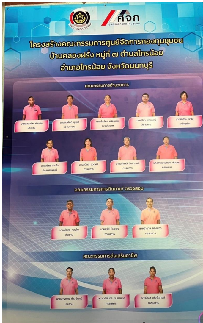
รูปที่ 2 โครงสร้างคณะกรรมการศูนย์จัดการกองทุนชุมชนบ้านคลองฝรั่ง