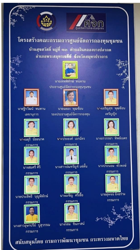
รูปที่ 1 โครงสร้างคณะกรรมการศูนย์จัดการกองทุนชุมชนบ้านคลองฝรั่ง