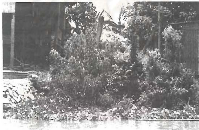
สภาพปากคลองคูจามด้านที่ติดกับแม่น้ำเจ้าพระยาในปัจจุบัน ซึ่งต้นเขินเนื่องจากไม่ได้ใช้งาน

สำหรับมัสยิดของชาวจามเดิมตั้งอยู่บริเวณใกล้ปากคลองคูจาม ตรงกับหนังสือ คำให้การของขุนหลวงวัดประดู่ว่า “...ที่ปากคลองคูจามมีสุเหร่าแขก” แต่ใน ปัจจุบันเนื่องจากน้ำในคลองคูจามแห้งลงชาวจามจึงย้ายมาอยู่ตรงปากคลอง ด้านติดกับแม่น้ำเจ้าพระยา โดยมีมัสยิดสร้างใหม่เพิ่มเป็น 3 มัสยิดคือ มัสยิด อามาดียะตุชชอลิฮาดิ มัสยิดอาลีอินนูรอยน์ และมัสยิดอิสลามวัฒนา สำหรับ กูบур (สุสาน) มีสองแห่ง แห่งแรกตั้งแต่สมัยกรุงศรีอยุธยา ปัจจุบันปรากฏซุ้ม ประตูกูบурก่ออิฐฉาบปูนเป็นซุ้มโค้งแบบมุสลิมและยังมีร่องรอยยอดโดมปรากฏ อยู่ ต่อมาในสมัยกรุงรัตนโกสินทร์ได้ย้ายมายังสถานที่แห่งใหม่ในปัจจุบันโดย ไม่ห่างจากสถานที่เดิมมากนัก