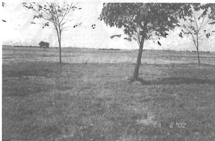
ทุ่งปากกระวาน อยุธยา อันเป็นที่เพาะปลูกของชาวจามตั้งแต่ในอดีต ปัจจุบันยังคงเป็นของชาวจามอยู่แต่ส่วนใหญ่ให้ผู้อื่นเช่า

นั่นคือหมู่บ้านชาวจามมีปรากฏหลักฐานว่ามีมาอย่างน้อยตั้งแต่ปี พ.ศ.1952 หรือเมื่อ 600 ปีผ่านมาแล้ว และเนื่องจากมุสลิมจามเหล่านี้มี ความสามารถในการเดินเรือและต่อเรือ จึงได้รับโปรดเกล้าฯจาก พระมหากษัตริย์ของไทยในสมัยต่อมาให้เป็นกองกำลังอาสาช่วยรบ ซึ่งมักจะ เป็นกำลังรบหลักทางเรือและในกรณีที่เป็นการยกพลทางบกมักจะเป็นกอง กำลังแนวหน้า และถูกเรียกว่า “อาสาจาม”