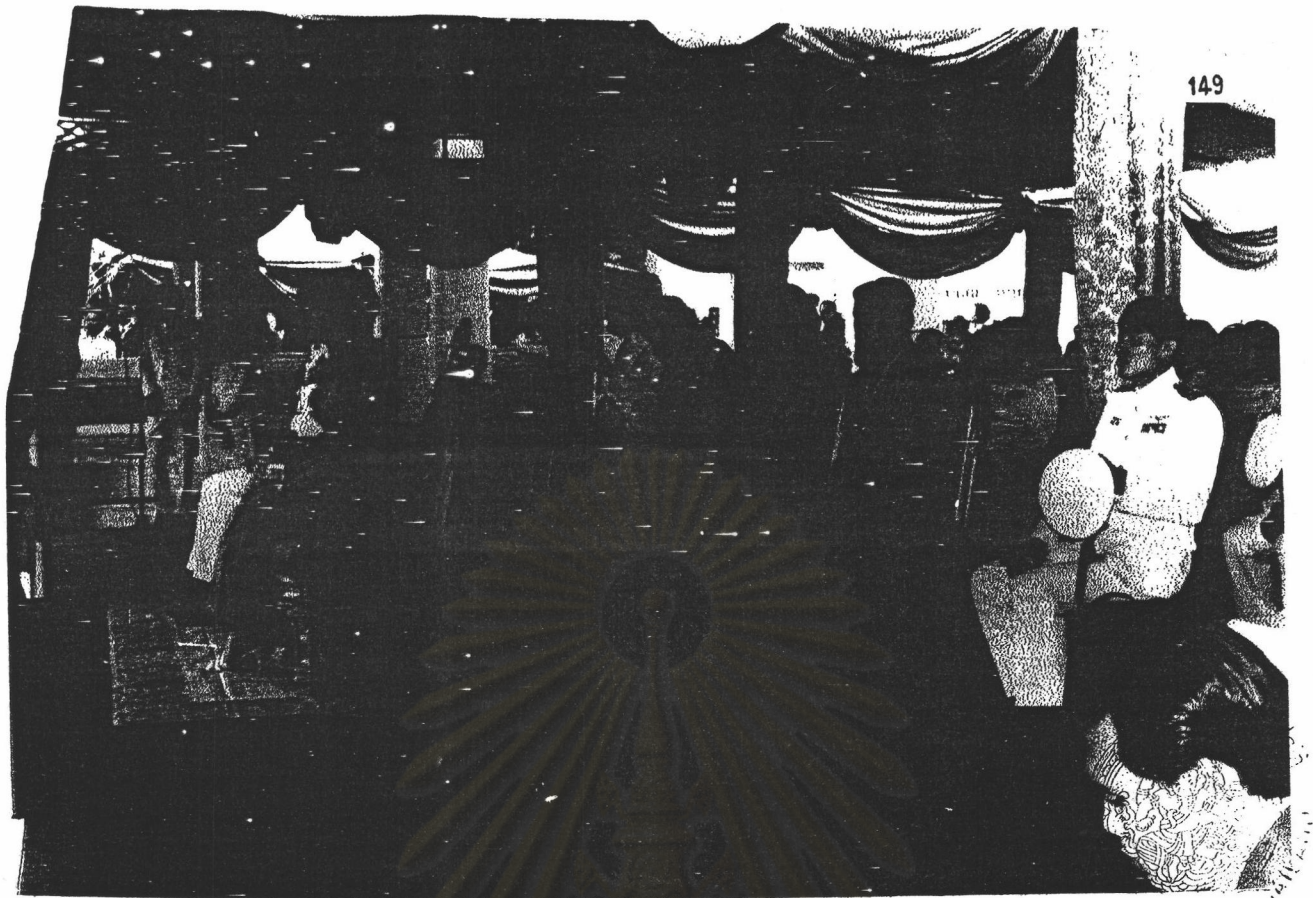
รูปภาพที่ 14 ภาพบางส่วนจากพระราชพิธีบวงสรวงพระสยามเทวาธิราช ในการพระราชพิธีสมโภชกรุงรัตนโกสินทร์ครบ 200 ปี พ.ศ. 2525