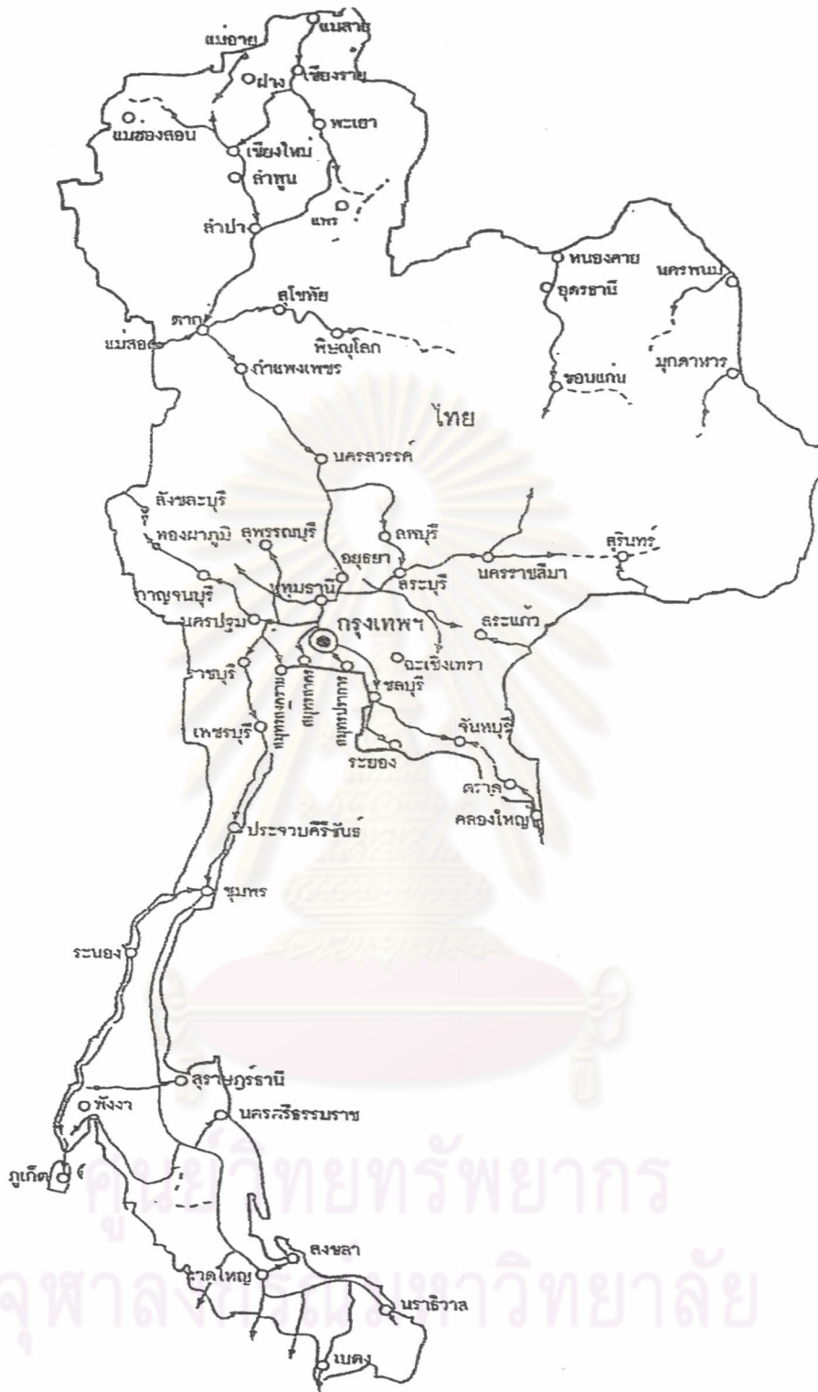
รูปที่ 2 เส้นทางขนส่งผู้หญิงและเด็กเพื่อค่าบริการทางเพศในประเทศไทย