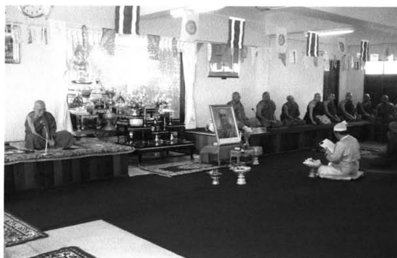
รูปที่ 7 การทำบุญในกลุ่มพระภิกษุพม่าในวันเกิดหลวงพ่อดีดมานันตะ

นอกจากประเพณีต่างของกลุ่มวัดพม่าในจังหวัดลำปางแล้วก็ยังมีงานวันเกิดหลวงพ่อดีดทำมะโอ ที่ถูกจัดขึ้นมาในช่วงสามปีที่ผ่านมาจนเป็นงานที่จะจัดทุกปีในช่วงเสาร์อาทิตย์ต้นเดือนมกราคม ในช่วงเดือนเกิดของหลวงพ่อดีดมานันตะอัครมหาบัณฑิต โดยวันเสาร์จะมีการทำบุญร่วมกันในกลุ่มพระภิกษุพม่าในภาคเหนือ จากจังหวัดพะเยา เชียงใหม่ และแม่ฮ่องสอน จะมาร่วมกัน ส่วนในวันอาทิตย์จะเชิญพระภิกษุไทยชั้นผู้ใหญ่ในจังหวัดลำปางมาร่วมทำบุญพร้อมกับญาติโยมเป็นจำนวนมาก