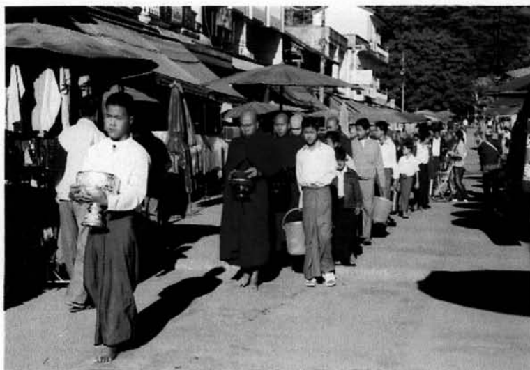
รูปที่ 1 การบิณฑบาตของพระภิกษุมอที่อำเภอท่าขี้เหล็กประเทศพม่า