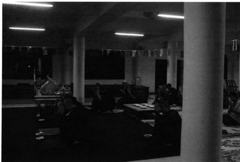
รูปที่ 5 การถวายข้าวหอมต๋อในเช้าวันออกพรรษา