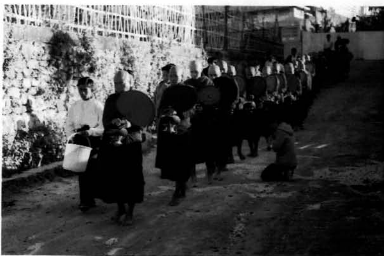
รูปที่ 2 การบิณฑบาตของพระภิกษุมอที่อำเภอท่าขี้เหล็กประเทศพม่า