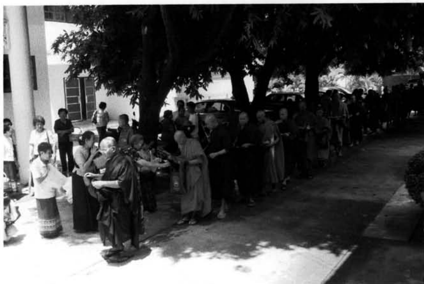
รูปที่ 3 การตัดบาตรดอกไม้ในการลงอุโบสถของกลุ่มวัดพม่าในจังหวัดลำปาง

การออกพรรษาของพม่านั้นจะออกพรรษาเร็วกว่าทางไทยหนึ่งวัน และในวันออกพรรษาของพม่า ทางวัดจะมีการเตรียมถวายข้าวแก่พระพุทธรเจ้าซึ่งเรียกว่า “ข้าวชอมต้อ” โดยในตอนเย็นทางวัดจะจัดเตรียมข้าวสาร ผลไม้ นม ขนม ใส่ถ้วยเพื่อให้ศรัทธา ญาติโยม นำไปถวายแก่พระพุทธรเจ้า โดยมีการจัดเตรียมสถานที่บริเวณศาลาวัดหรือ “จอง” หลังจากนั้นเวลาประมาณตีสามก็จะมีการต้มข้าวหรือกวนข้าวทิพย์ (ในอดีตจะต้องใช้หญิงสาวพรหมจรรย์) เพื่อถวายแก่พระพุทธรเจ้า โดยมีผู้ศรัทธาอุบาสกอุบาสิกาเป็นคนจัด เวลาประมาณตีห้าครึ่งจึงมีการนิมนต์พระเถระ และศรัทธาญาติโยม ถวายอาหารแก่พระพุทธรเจ้าในวันออกพรรษา เป็นอันเสร็จพิธี