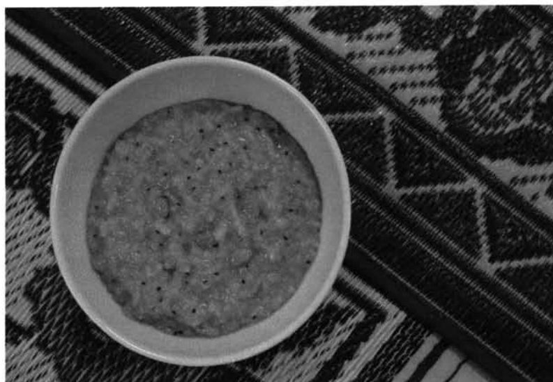
รูปที่ 4 ข้าวหอมต๋อที่นำมาถวายในเช้าวันออกพรรษา