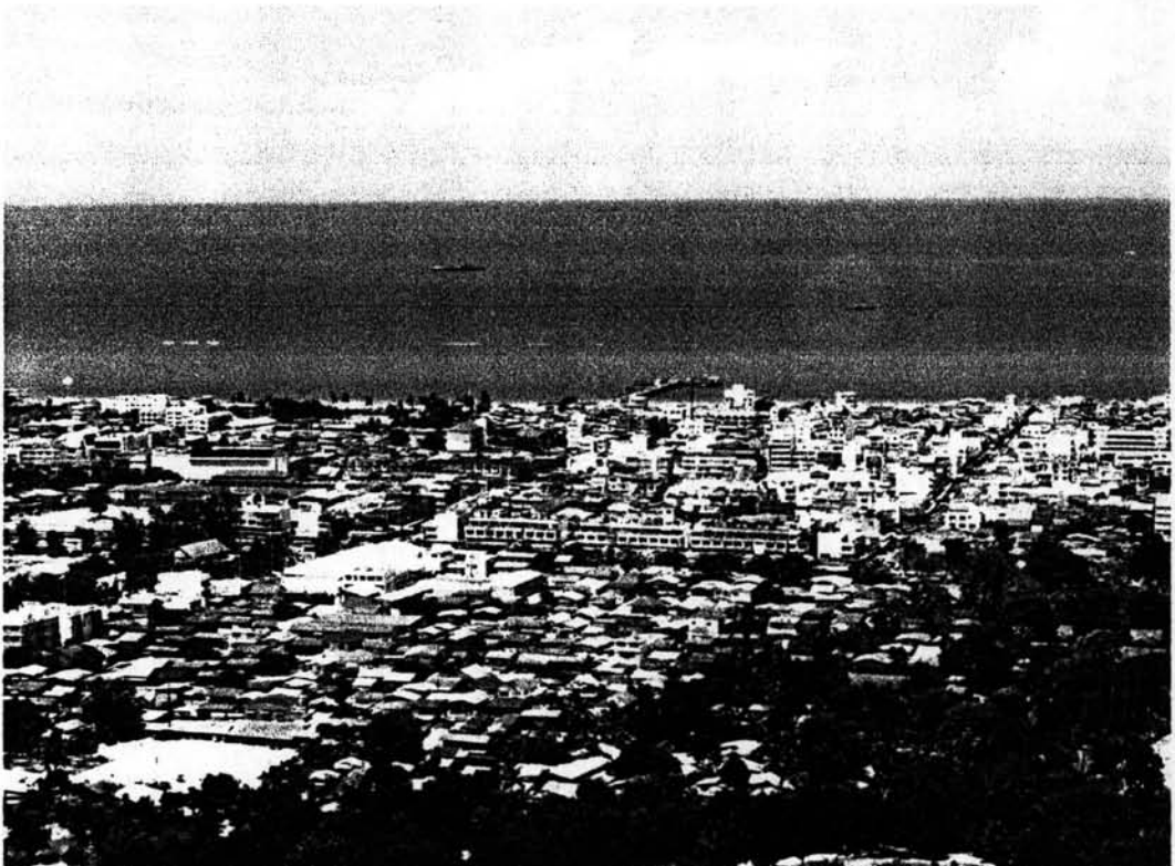
ภาพที่ 1.2 สภาพชุมชนเมืองหัวหิน ปี พ.ศ. 2547