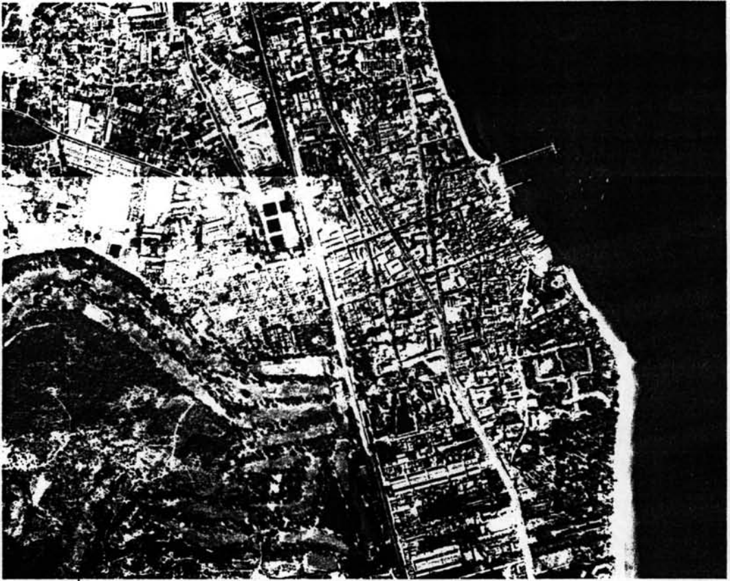
ภาพที่ 1.1 ภาพถ่ายทางอากาศของชุมชนเมืองหัวหิน ปี พ.ศ. 2547