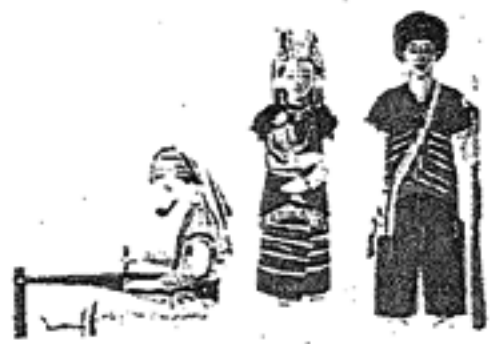
กะเหรี่ยงไม้วัว