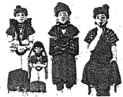
กะเหรี่ยงสะกอ