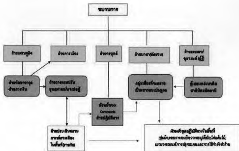
รูปที่ 26 แผนภาพแสดงโครงสร้างของกลุ่มชนวนการผู้ก่อความไม่สงบในเขตอำเภอระแงะ

สำหรับในเขตพื้นที่อำเภอระแงะการจัดตั้งของกลุ่มชนวนการจะแบ่งพื้นที่การปกครองออกเป็นเขต ส่วนการดูแลและควบคุมหมู่บ้านจะมีแต่ละฝ่ายรับผิดชอบ ในตำบลเดียวกัน แต่ละหมู่บ้านจะมีข้อกำหนดแตกต่างกัน การตัดสินใจในเรื่องใดเรื่องหนึ่งผู้ปกครองจะมีความเป็นอิสระต่อกัน ไม่ก้าวก่ายและไม่ยุ่งเกี่ยวกับ โดยผู้ที่เป็นอัมเยาะห์ หรือผู้ใหญ่บ้านเงา จะมีลูกน้องที่อยู่ในระดับหัวหน้า Rkk Commando จำนวน 10 คน โดยแต่ละคนในจำนวนนี้จะต้องไปหาลูกน้องที่อาจเป็นกลุ่มเยาวชนเปอรูมุดหรือเปอรูมูตี* ได้อีกคนละ 15 คน ส่วนการปกครองในระดับที่สูงกว่านี้เฉพาะ Wilayah (Wilayah) หรือ "เขตงาน" ในพื้นที่ อ.ระแงะจังหวัดนราธิวาส จะมีหัวหน้าเรียกว่า กัส ซึ่งถือว่าสูงกว่าเขต โดยเขตที่เรียกว่าแลกันลันจะทำหน้าที่คุมความเคลื่อนไหวใน 2-3 อำเภอ ในแต่ละอำเภอจะมีภูมิตรหรือหัวหน้าเป็นผู้ดูแลอีกชั้นหนึ่งประมาณ 4-6 หมู่บ้าน จากนั้นจึงเป็นหน้าที่ของอัมเยาะห์หรือผู้ใหญ่บ้านเงาสำหรับพื้นที่ อ.ระแงะ จะมีการจัดตั้งหมู่บ้านเงาเกือบทุกพื้นที่ อัมเยาะห์จำเป็นต้องมีผู้ช่วยเหลือฝ่ายต่างๆ แต่จะจับตาความเคลื่อนไหวที่