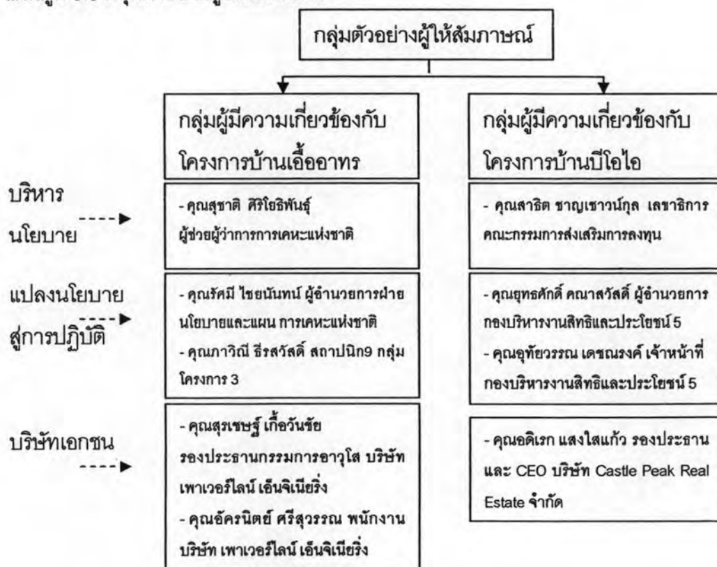
แผนภูมิ 3.3 กลุ่มตัวอย่างผู้ให้สัมภาษณ์