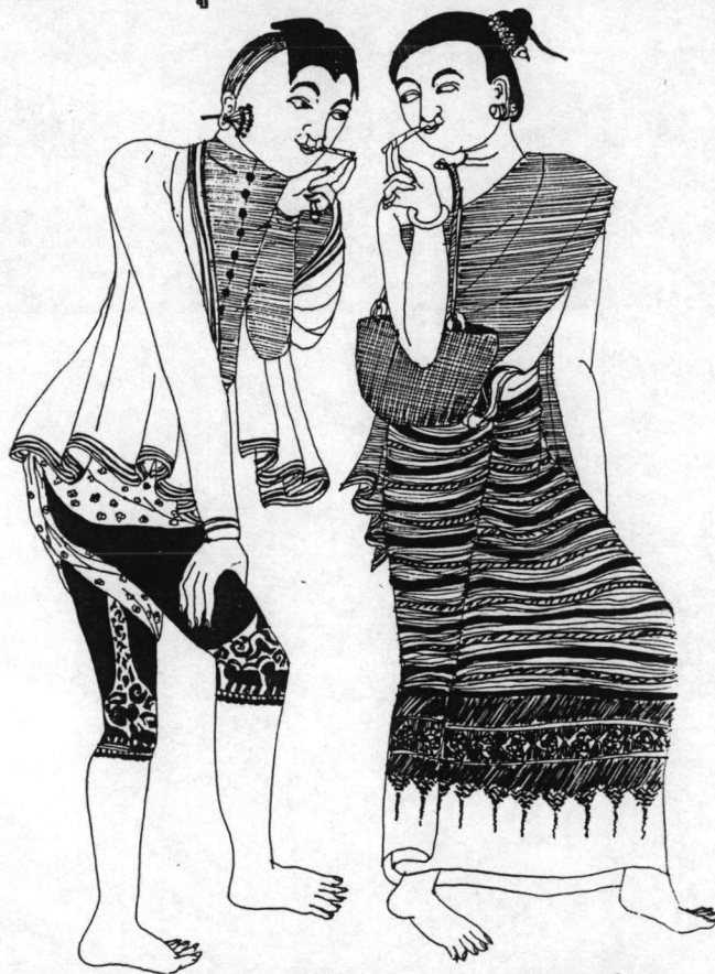
จิตรกรรมฝาผนังวัดภูมินทร์ จ.น่าน แสดงให้เห็นถึงความนิยมในการสักหมึกและการขวากหูตือลานของชาวล้านนา

สำหรับผู้หญิง พม่าบังคับให้ผู้หญิงในหัวเมืองล้านนาต้องเจาะหูให้กว้างแล้วม้วนใบลานใส่ เรียกว่า "ขวากหูตือลาน" ถ้าเป็นชาวบ้านธรรมดาจะม้วนใบลานสอดรู ส่วนผู้มีฐานะหรือเจ้านาย สตรีสูงศักดิ์จะใช้เงินหรือทองคำตีแผ่นบางๆม้วนใส่แทนใบลาน 57 ต่อมากลายเป็นประเพณีนิยมในสังคมล้านนาที่หญิงสาวต้อง "ขวากหูตือลาน" เป็นการประดับประดาร่างกายที่ผู้ชายก็มักจะนิยมเจาะด้วยเช่นกัน