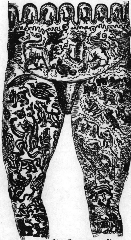
การสักหมึกของชายล้านนา