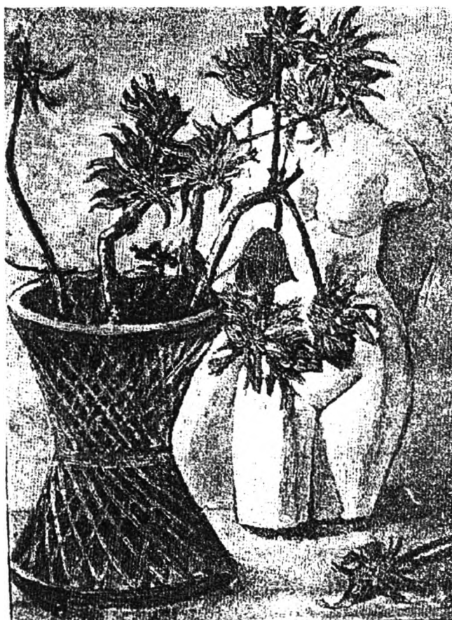
ภาพที่ 4 ภาพวินัส