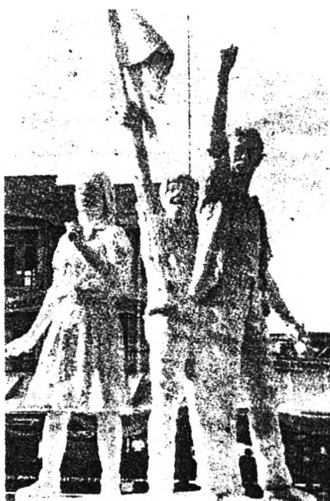
ภาพที่ 1 งานประติมากรรมในงานครบรอบ 2 ปี 14 ตุลาคม 16

“...ประกอบด้วย figure ของคน 3 คน มีคนหนึ่งกำลังชูมือว่าสู้ และอีกคนก็โบกธง และก็ได้เด็กผู้หญิง เราก็ปั้นคนละตัว คือไปปั้นสดเลย ใช้ปูนปลาสเตอร์ คือธรรมดาปูนจะต้องปั้นด้วยดินเหนียวแล้วหล่อเอา แต่เนื่องจากว่ามันเป็นงานจุลจกฐิน เราคงจะไม่เก็บไว้ เราก็ใช้ปั้นสดเอา...”