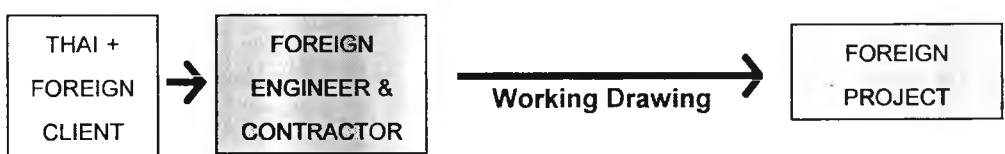
แผนภาพที่ 5.3 รูปแบบการให้บริการงานออกแบบ แบบที่ 3