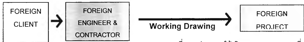
แผนภาพที่ 5.5 รูปแบบการให้บริการงานออกแบบ แบบที่ 5