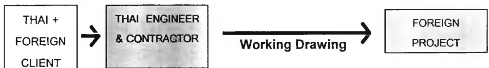
แผนภาพที่ 5.2 รูปแบบการให้บริการงานออกแบบ แบบที่ 2