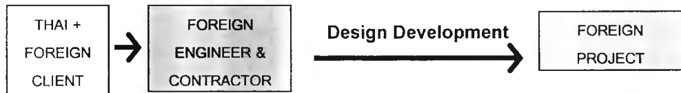
แผนภาพที่ 5.1 รูปแบบการให้บริการงานออกแบบ แบบที่ 1