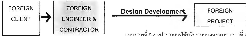
แผนภาพที่ 5.4 รูปแบบการให้บริการงานออกแบบ แบบที่ 4