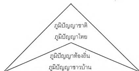
แผนภูมิที่ 1 ระดับภูมิปัญญาไทย (รุ่ง แก้วแดง, 2542)

รุ่ง แก้วแดง (2542) แบ่งภูมิปัญญาไทยออกได้เป็น 2 ระดับ คือ ภูมิปัญญาชาติหรือภูมิปัญญาไทย กับภูมิปัญญาท้องถิ่นหรือภูมิปัญญาชาวบ้าน โดยมีระดับผังแผนภูมิที่ 1 ดังนี้