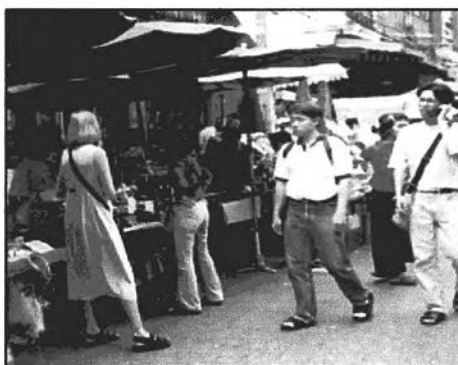
ภาพที่ 4-3 ย่านค้าของมือสอง ตลาดคลองถม