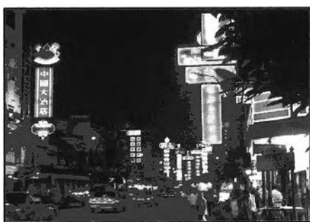
ภาพที่ 4-4 ถนนเยาวราชในเวลากลางคืน

แม้แต่ตลาดกลางคืน แต่ละย่านยังมีความแตกต่างกัน ซึ่งทั้งหมดนั้นเป็นไปโดยธรรมชาติ โดยในช่วงเวลากลางคืนนั้น จะโดดเด่นที่ย่านอาหารตรอกถนนเยาวราช ที่จะมีบรรยากาศแตกต่างจากช่วงเวลากลางวันเป็นอย่างมาก ตั้งแต่ช่วงเวลา 5-6 โมงเย็นเป็นต้นไป ร้านค้าต่างๆในช่วงกลางคืนจะเริ่มเปิด และร้านค้า อาหารต่างๆ จะเริ่มตั้งร้าน ทั้งร้านร้านเล็กใหญ่ แผงลอยต่างๆ ไปตามถนนเยาวราชสองฝั่งทาง ตั้งแต่เวลาประมาณหนึ่งทุ่มเป็นต้นไป ร้านค้าต่างๆจะเริ่มแน่นไปด้วยผู้คน จากย่านการค้าทองกลายเป็นย่านค้าอาหารแทน อาหารแปลกๆ อร่อยและราคาถูกมากมาย ล้วนแต่มารวมกันอยู่ที่นี่