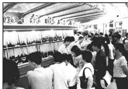
ภาพที่ 4-2 ย่านค้าทองเยาวราช