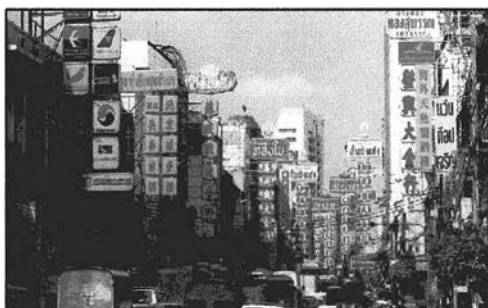
ภาพที่ 4-1 ถนนเยาวราชเวลากลางวัน

ย่านเยาวราชจะเป็นย่านร้านค้าทอง ที่เรียกกันว่า "ถนนสายทองคำ" ร้านค้าทองจำนวนมากอยู่ทั้งสองฝั่งถนนเยาวราช ถือเป็นตลาดค้าทองที่สำคัญที่สุดของประเทศก็ว่าได้ ย่านสำเพ็งนั้นจะมีร้านค้าต่างๆมากมาย จำพวกร้านขายผ้า เสื้อผ้า ของชำร่วย ของที่ระลึก ตลอดจนของจุกจิกต่างๆ ที่สำคัญ คือ มีราคาถูก จึงเป็นที่นิยมของนักท่องเที่ยวทั้งชาวไทย และต่างประเทศ ที่จะเข้ามาเลือกซื้อมากมาย โดยเฉพาะช่วงวันหยุดที่มีทั้งประชาชน และนักท่องเที่ยวจากที่ต่างๆ เข้ามาเดินเลือกซื้อสินค้า ส่วนคลองถมนั้น จะเป็นย่านขายของแผงลอยเป็นส่วนใหญ่ เป็นย่านการค้าของเก่า ของมือสอง ราคาถูกมากมาย โดยเฉพาะเครื่องใช้ไฟฟ้าต่างๆ เป็นต้น