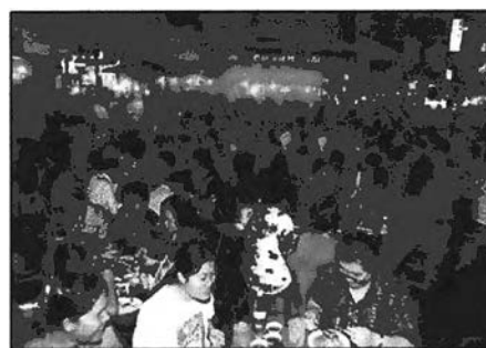
ภาพที่ 4-5 ร้านค้าอาหารต่างๆในเยาวราช

ในส่วนของย่านสำเพ็งนั้น ตลาดกลางคืนจะเริ่มในช่วงเวลาเข้ามืด ซึ่งสินค้าที่นำมาจำหน่ายจะมีราคาถูกกว่าช่วงที่ขายในเวลากลางวันอย่างมาก ซึ่งพ่อค้าแม่ค้าซึ่งจำหน่ายสินค้าปลีกจะนิยมมาซื้อในช่วงเวลานี้ เพื่อนำไปจำหน่ายเก็งกำไร เริ่มจำหน่ายในเวลา 3.00 น. โดยประมาณ นอกจากนี้ ย่านคลองถมจะมีตลาดสินค้ามือสองจำหน่ายในเวลากลางคืนเช่นเดียวกัน