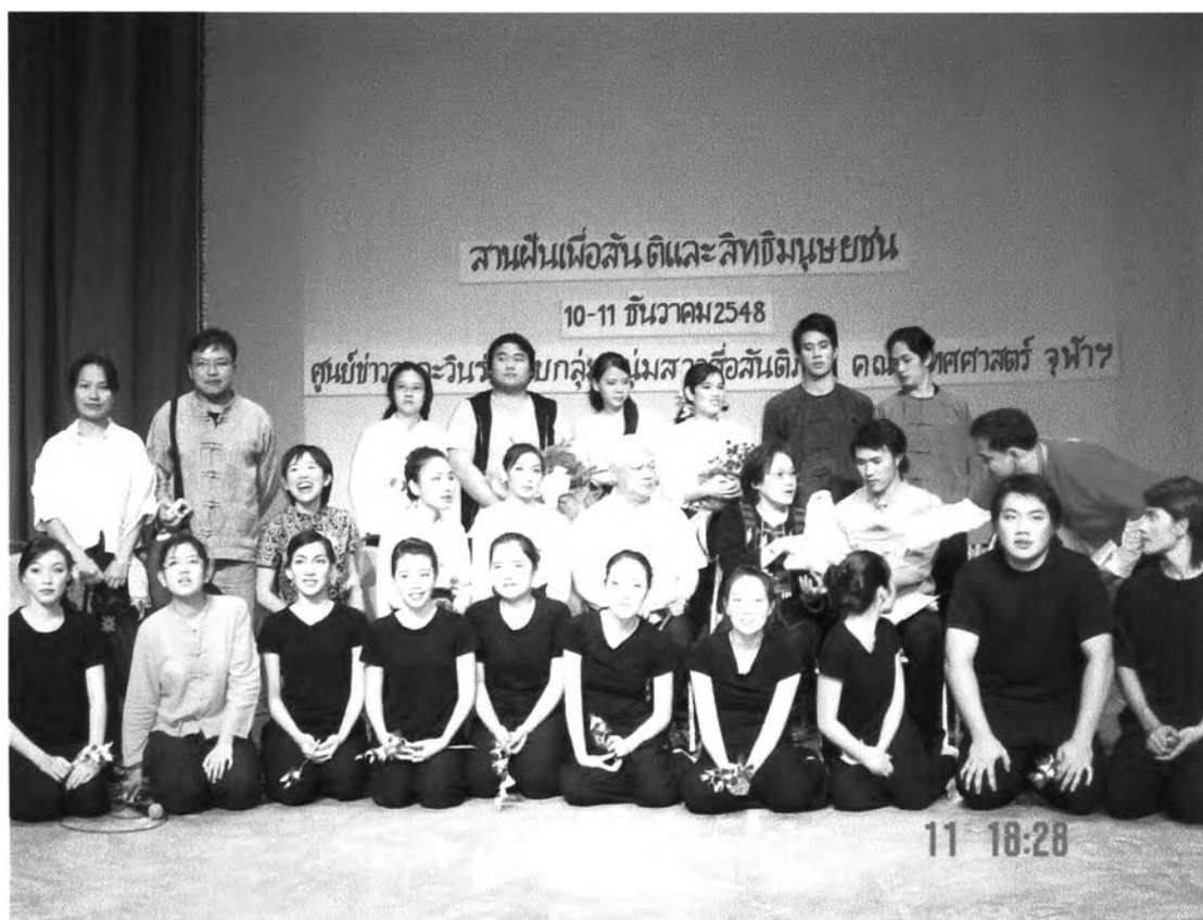
คณะผู้ร่วมกิจกรรม ทั้งคณาจารย์ นิสิต นักศึกษา และผู้ชมการแสดง ณ หอนิทรรศการศิลปวัฒนธรรม มหาวิทยาลัยเชียงใหม่