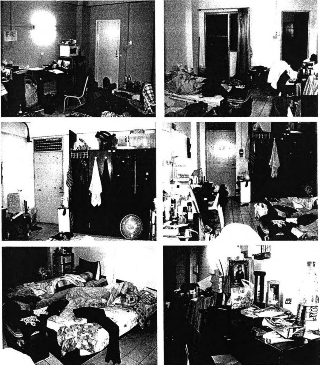
รูปที่ 6.2 แสดงภาพถ่ายตัวอย่างห้องพักที่ไม่เป็นระเบียบของนักศึกษาหอพักมหาวิทยาลัย