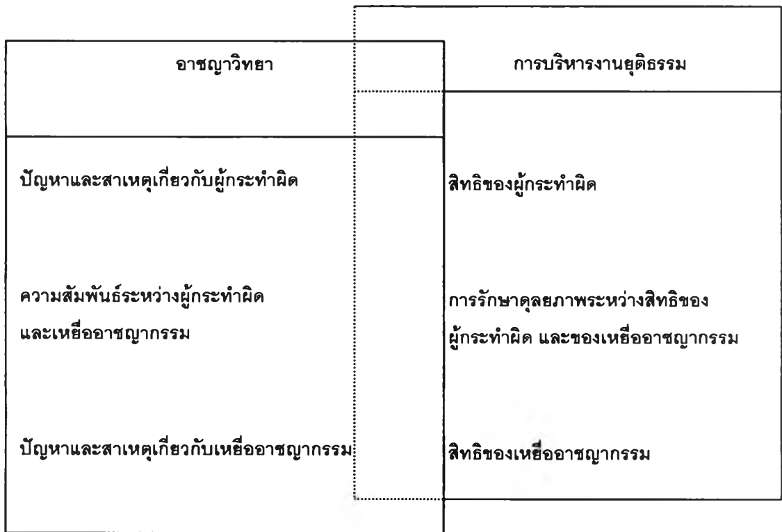
รูปภาพที่ 2: ความเชื่อมโยงระหว่างอาชญาวิทยาและการบริหารงานยุติธรรมในประเด็นเกี่ยวกับผู้กระทำผิด และเหยื่ออาชญากรรม

(5) การป้องกันทางสังคมและเศรษฐกิจ-ผู้ที่มีแนวโน้มจะตกเป็นเหยื่ออาชญากรรมจะได้รับความคุ้มครองตามนโยบายทางเศรษฐกิจ สังคม และอาญาเพื่อลดความเสี่ยงของการตกเป็นเหยื่ออาชญากรรม