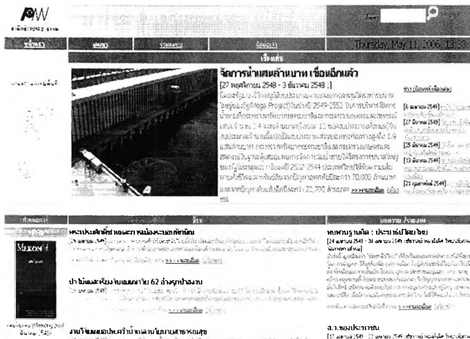
ภาพที่ 2: แสดงหน้าเว็บไซต์ของสำนักข่าวประชาธรรม (www.newspnn.org)