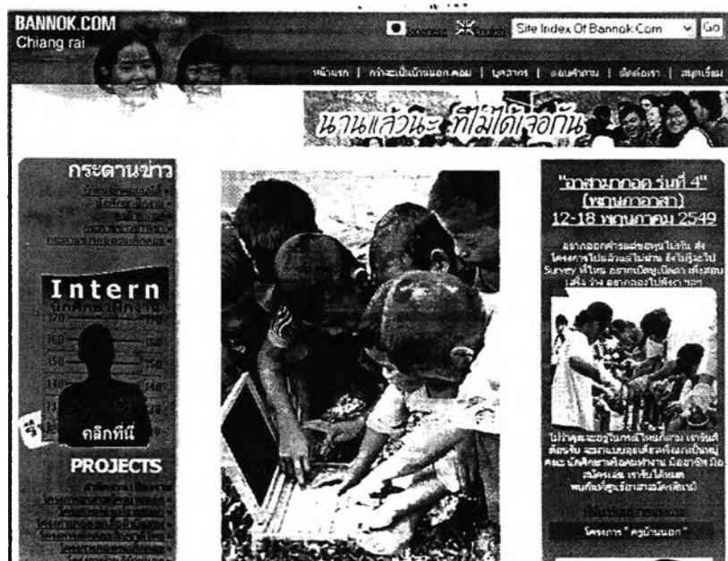
ภาพที่ 1: แสดงหน้าเว็บไซต์ของเว็บไซต์บ้านนอกดีอทคอม (www.bannok.com)