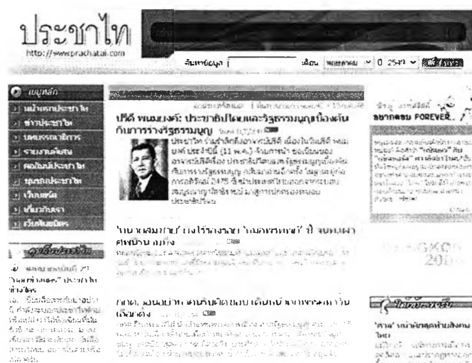
ภาพที่ 3: แสดงหน้าเว็บไซต์ของประชาไท (www.prachathai.com)