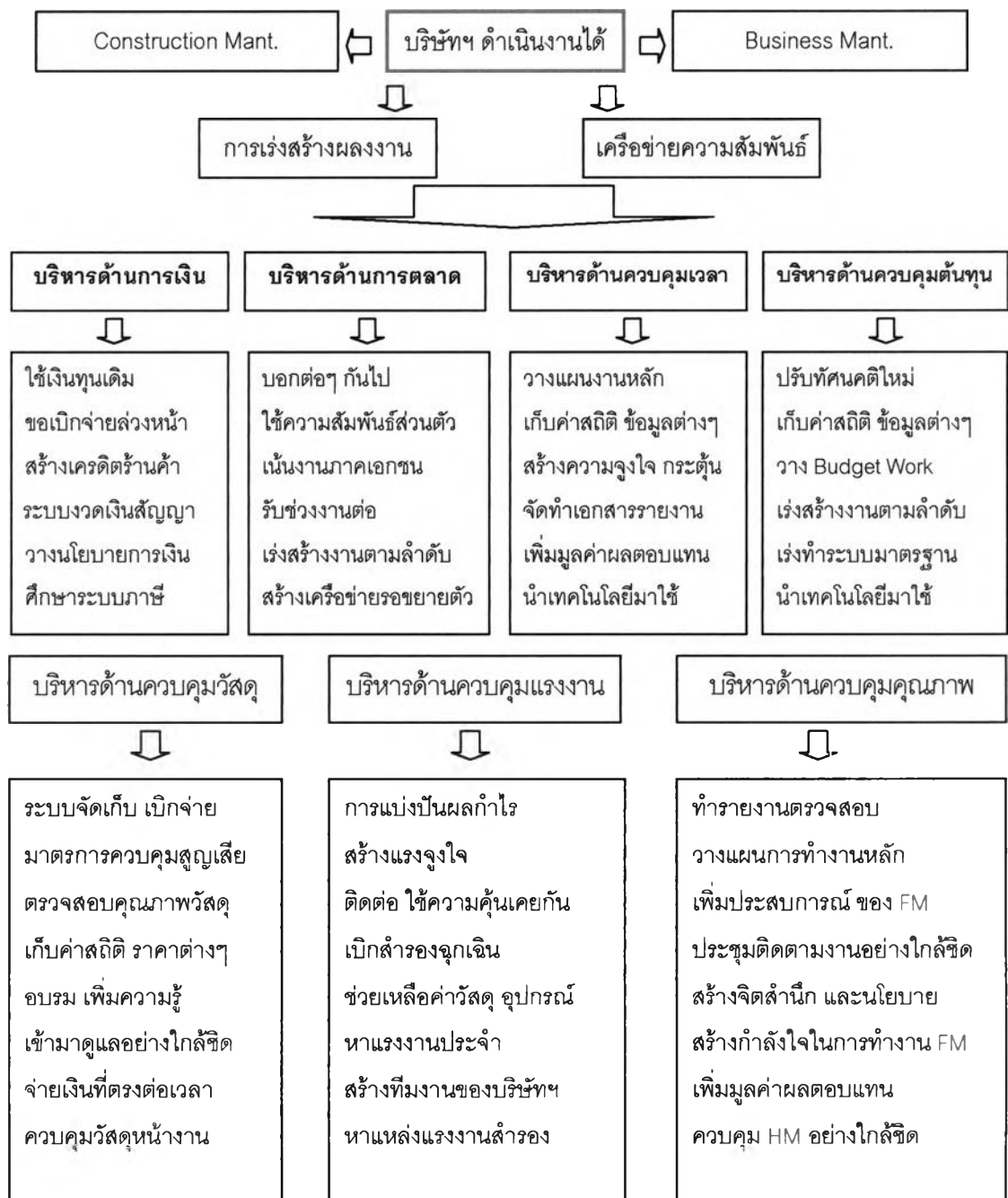
แผนภาพที่ 6.1. สรุปภาพรวมการศึกษา

โดยรายละเอียดต่างๆ ทั้งหมด สามารถสรุปเป็นภาพรวม ดังแผนภาพที่ 6.1.