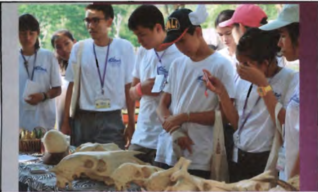
โครงการอนุรักษ์พันธุกรรมพืชอันเนื่องมาจากพระราชดำริ สมเด็จพระเทพรัตนราชสุดาฯ สยามบรมราชกุมารี ค่ายเยาวชน ความหลากหลายทางชีวภาพและการอนุรักษ์ทรัพยากรธรรมชาติระหว่างวันที่ 26 - 31 มีนาคม 2556 นิเวศวิทยาสัตว์ในสภาพพื้นที่เพาะเลี้ยง