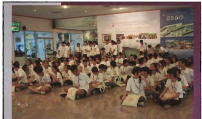
โครงการอนุรักษ์พันธุกรรมพืชอันเนื่องมาจากพระราชดำริ สมเด็จพระเทพรัตนราชสุดาฯ สยามบรมราชกุมารี ค่ายเยาวชน ความหลากหลายทางชีวภาพและการอนุรักษ์ทรัพยากรธรรมชาติระหว่างวันที่ 26 - 31 มีนาคม 2556