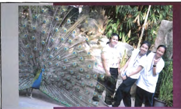
โครงการอนุรักษ์พันธุกรรมพืชอันเนื่องมาจากพระราชดำริ สมเด็จพระเทพรัตนราชสุดาฯ สยามบรมราชกุมารี ค่ายเยาวชน ความหลากหลายทางชีวภาพและการอนุรักษ์ทรัพยากรธรรมชาติระหว่างวันที่ 26 - 31 มีนาคม 2556 นิเวศวิทยาสัตว์ในสภาพพื้นที่เพาะเลี้ยง