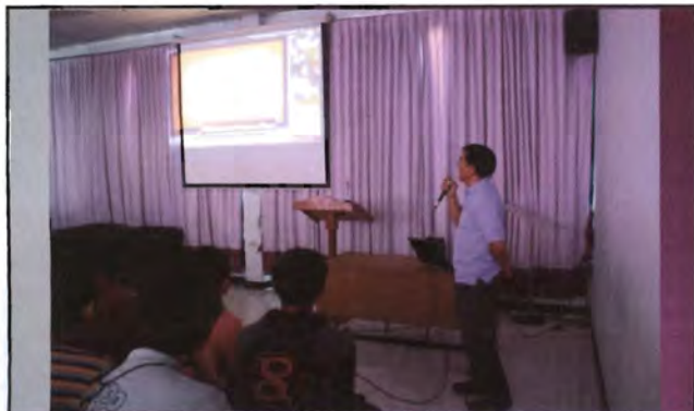
โครงการอนุรักษ์พันธุกรรมพืชอันเนื่องมาจากพระราชดำริ สมเด็จพระเทพรัตนราชสุดาฯ สยามบรมราชกุมารี ค่ายเยาวชน ความหลากหลายทางชีวภาพและการอนุรักษ์ทรัพยากรธรรมชาติระหว่างวันที่ 26 - 31 มีนาคม 2556