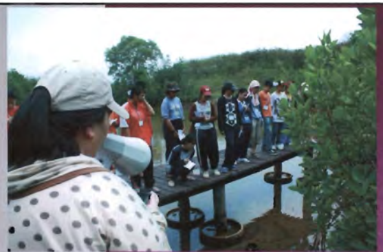
โครงการอนุรักษ์พันธุกรรมพืชอันเนื่องมาจากพระราชดำริ สมเด็จพระเทพรัตนราชสุดาฯ สยามบรมราชกุมารี ค่ายเยาวชน ความหลากหลายทางชีวภาพและการอนุรักษ์ทรัพยากรธรรมชาติระหว่างวันที่ 26 - 31 มีนาคม 2556