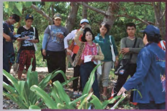
โครงการอนุรักษ์พันธุกรรมพืชอันเนื่องมาจากพระราชดำริ สมเด็จพระเทพรัตนราชสุดาฯ สยามบรมราชกุมารี ค่ายเยาวชน ความหลากหลายทางชีวภาพและการอนุรักษ์ทรัพยากรธรรมชาติระหว่างวันที่ 26 - 31 มีนาคม 2556