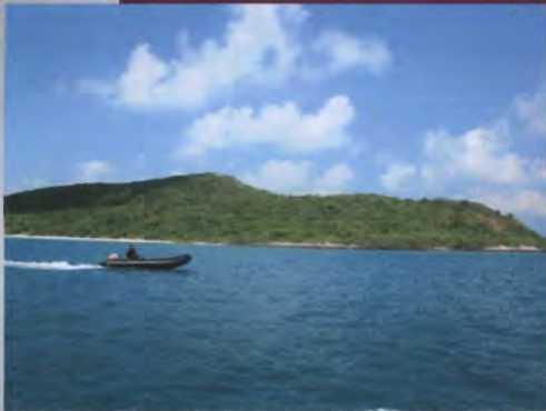
โครงการอนุรักษ์พันธุกรรมพืชอันเนื่องมาจากพระราชดำริ สมเด็จพระเทพรัตนราชสุดาฯ สยามบรมราชกุมารี ค่ายเยาวชน ความหลากหลายทางชีวภาพและการอนุรักษ์ทรัพยากรธรรมชาติระหว่างวันที่ 26 - 31 มีนาคม 2556