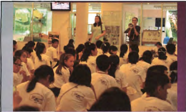
โครงการอนุรักษ์พันธุกรรมพืชอันเนื่องมาจากพระราชดำริ สมเด็จพระเทพรัตนราชสุดาฯ สยามบรมราชกุมารี ค่ายเยาวชน ความหลากหลายทางชีวภาพและการอนุรักษ์ทรัพยากรธรรมชาติระหว่างวันที่ 26 - 31 มีนาคม 2556 นิเวศวิทยาสัตว์ในสภาพพื้นที่เพาะเลี้ยง