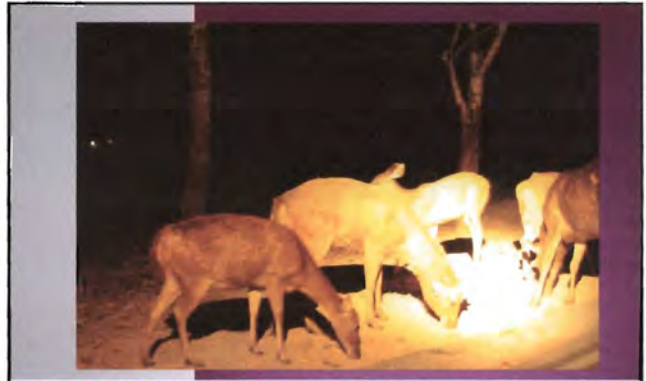
โครงการอนุรักษ์พันธุกรรมพืชอันเนื่องมาจากพระราชดำริ สมเด็จพระเทพรัตนราชสุดาฯ สยามบรมราชกุมารี ค่ายเยาวชน ความหลากหลายทางชีวภาพและการอนุรักษ์ทรัพยากรธรรมชาติระหว่างวันที่ 26 - 31 มีนาคม 2556 พฤติกรรมของสัตว์กลางคืน (After Dark - Night Safari)