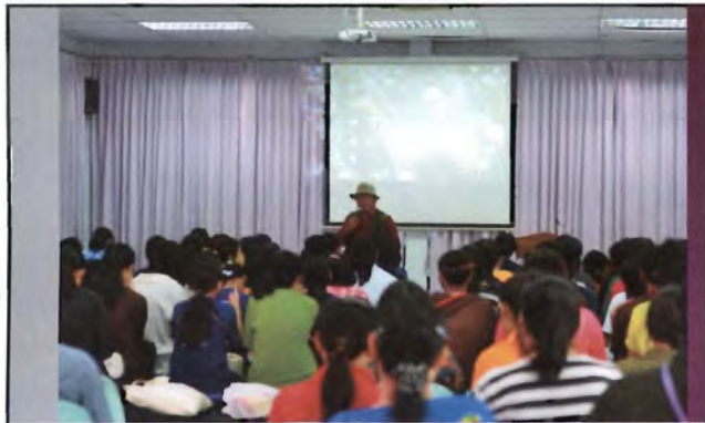
โครงการอนุรักษ์พันธุกรรมพืชอันเนื่องมาจากพระราชดำริ สมเด็จพระเทพรัตนราชสุดาฯ สยามบรมราชกุมารี ค่ายเยาวชน ความหลากหลายทางชีวภาพและการอนุรักษ์ทรัพยากรธรรมชาติระหว่างวันที่ 26 - 31 มีนาคม 2556