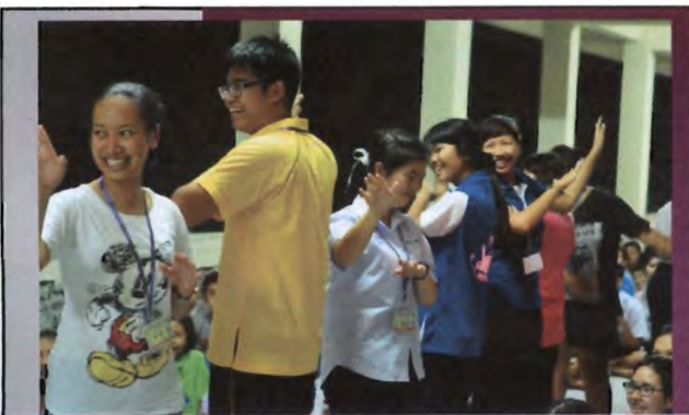
โครงการอนุรักษ์พันธุกรรมพืชอันเนื่องมาจากพระราชดำริ สมเด็จพระเทพรัตนราชสุดาฯ สยามบรมราชกุมารี ค่ายเยาวชน ความหลากหลายทางชีวภาพและการอนุรักษ์ทรัพยากรธรรมชาติระหว่างวันที่ 26 - 31 มีนาคม 2556