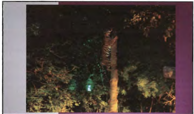
โครงการอนุรักษ์พันธุกรรมพืชอันเนื่องมาจากพระราชดำริ สมเด็จพระเทพรัตนราชสุดาฯ สยามบรมราชกุมารี ค่ายเยาวชน ความหลากหลายทางชีวภาพและการอนุรักษ์ทรัพยากรธรรมชาติระหว่างวันที่ 26 - 31 มีนาคม 2556 พฤติกรรมของสัตว์กลางคืน (After Dark - Night Safari)