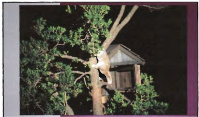
โครงการอนุรักษ์พันธุกรรมพืชอันเนื่องมาจากพระราชดำริ สมเด็จพระเทพรัตนราชสุดาฯ สยามบรมราชกุมารี ค่ายเยาวชน ความหลากหลายทางชีวภาพและการอนุรักษ์ทรัพยากรธรรมชาติระหว่างวันที่ 26 - 31 มีนาคม 2556 พฤติกรรมของสัตว์กลางคืน (After Dark - Night Safari)