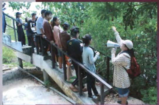
โครงการอนุรักษ์พันธุกรรมพืชอันเนื่องมาจากพระราชดำริ สมเด็จพระเทพรัตนราชสุดาฯ สยามบรมราชกุมารี ค่ายเยาวชน ความหลากหลายทางชีวภาพและการอนุรักษ์ทรัพยากรธรรมชาติระหว่างวันที่ 26 - 31 มีนาคม 2556