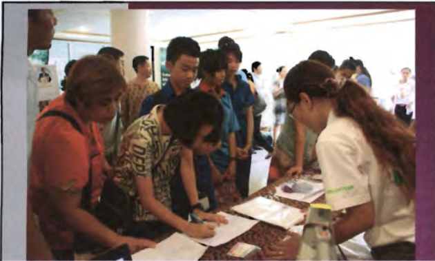
โครงการอนุรักษ์พันธุกรรมพืชอันเนื่องมาจากพระราชดำริ สมเด็จพระเทพรัตนราชสุดาฯ สยามบรมราชกุมารี ค่ายเยาวชน ความหลากหลายทางชีวภาพและการอนุรักษ์ทรัพยากรธรรมชาติระหว่างวันที่ 26 - 31 มีนาคม 2556