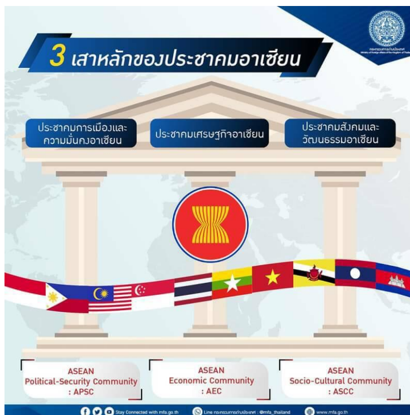
ภาพที่ 3 เสาหลักประชาคมอาเซียน

การวิจัย (สกว.) ฝ่ายวิจัยเพื่อท้องถิ่นจึงเสนอให้ศูนย์ประสานงานวิจัยเพื่อท้องถิ่นจังหวัดศรีสะเกษ ทดลองขับเคลื่อนงานวิจัยท้องถิ่นบนฐานของชุมชนชายแดนระหว่างประเทศ