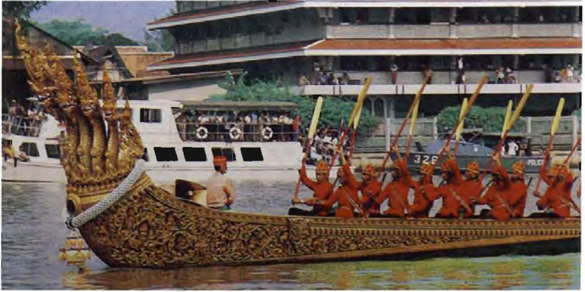
เรือพระที่นั่งอนันตนาคราช