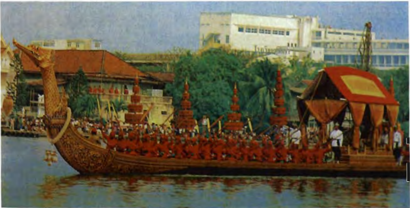
เรือพระที่นั่งสุพรรณหงส์