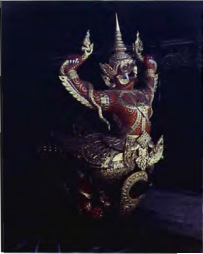
เรือครุฑเทินระเห็จ