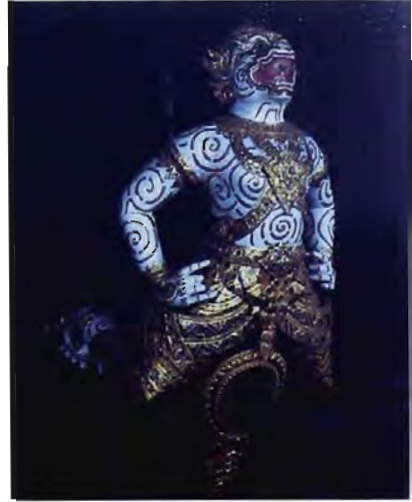
เรือกระบี่ปราบเมืองมาร