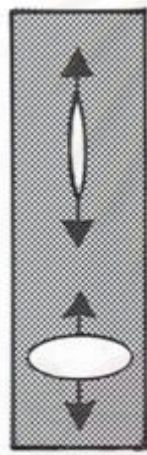
(รูปที่ 3 B)

ทิศทางการขยายของรูจากการแทงเข็ม Bevel ขนานกับแนวของเยื่อ dura