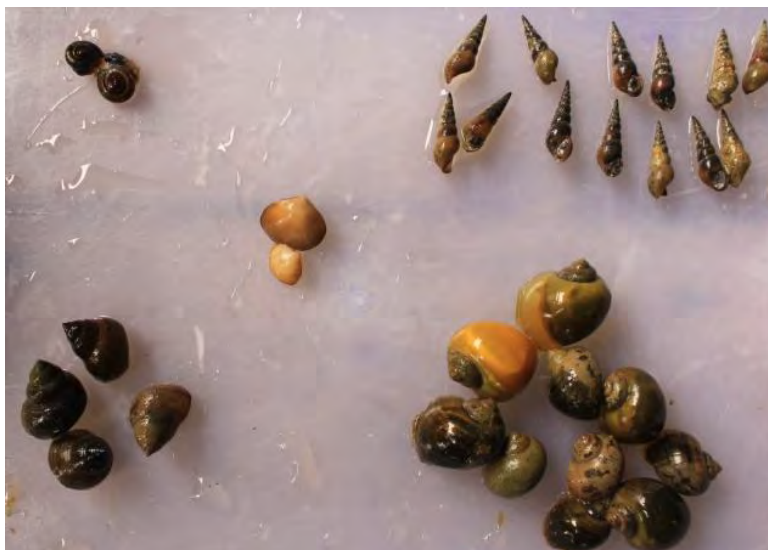
ภาพที่ 2 ตัวอย่างหอยน้ำจืดที่พบจากทั้ง 3 บริเวณ ได้แก่ หอยฝาเดียวแบบแบนขดเป็นก้นหอย (ซ้ายบน), หอยเจดีย์ (ขวาบน), หอยสองฝา (กลาง), หอยจู้บหรือหอยขม (ซ้ายล่าง) และหอยฝาเดียว unknown A (ขวาล่าง)

ทำการตรวจหาเชอร์คาเรียในตัวอย่งหอยจำนวน 247 ตัวอย่าง ที่เก็บมาจาก 3 พื้นที่ โดยใช้ค้อนทุบเปลือกหอยให้แตกออก แล้วใช้ปากคีบคีบเนื้อหอยส่วนที่นิ่มวางบนสไลด์ กดทับเนื้อหอยด้วยสไลด์อีกแผ่นหนึ่ง จากนั้นจึงนำไปตรวจหาเชอร์คาเรียในเนื้อเยื่อของหอยน้ำจืดภายใต้กล้องจุลทรรศน์ และหาเปอร์เซ็นต์การพบปรสิต ดังนี้