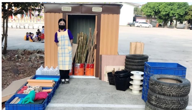
แผนภาพที่ 3 ครูเป็นผู้จัดเตรียมสภาพแวดล้อม สื่อวัสดุอุปกรณ์ลูสพาร์ตส์

ขั้นที่ 1 การเตรียมความพร้อม ครูเป็นผู้จัดเตรียมสภาพแวดล้อม สื่อวัสดุอุปกรณ์ ลูสพาร์ตส์ แนะนำหัวเรื่องของการเล่นให้กับเด็ก และสร้างข้อตกลงร่วมกับเด็กก่อนการเล่น โดยครู กระตุ้นให้เด็กช่วยกันสร้างข้อตกลง ครูทำหน้าที่ใช้คำถามกระตุ้น โดยครูใช้คำถามว่า “กิจกรรมการเล่นในวันนี้เด็ก ๆ คิดว่าเราควรมีข้อตกลงอะไรบ้าง”