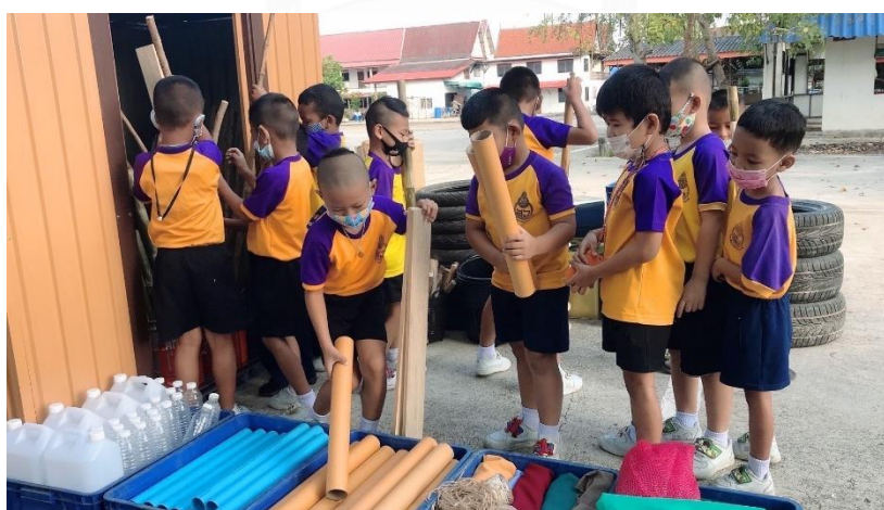
แผนภาพที่ 6 เด็กสำรวจอุปกรณ์ และแบ่งกลุ่มการเล่นร่วมกันเป็นกลุ่มย่อย