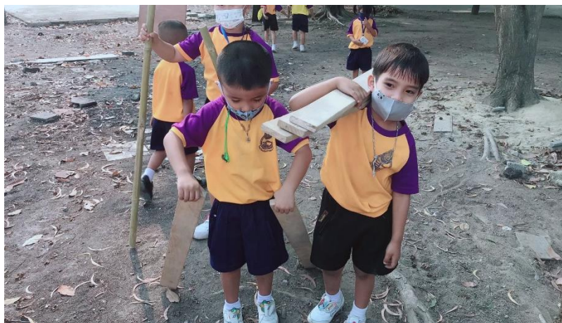
แผนภาพที่ 12 เด็กช่วยกันเก็บอุปกรณ์หลังได้ยินสัญญาณ

ขั้นที่ 4 การให้เด็กเก็บอุปกรณ์ ครูให้สัญญาณการหยุดเล่นเพื่อให้เด็กเก็บวัสดุอุปกรณ์ลูสพาร์ตส์ และทำความสะอาดร่างกาย หลังจากนั้นครูและเด็กร่วมกันแลกเปลี่ยนความคิดเห็น ครูทำหน้าที่ใช้คำถามกระตุ้นความคิดเด็ก โดยครูใช้คำถามว่า “เด็ก ๆ ได้เก็บของเล่นครบทุกคนหรือไม่” และ “การเล่นเมื่อ สักครู่นี้เด็ก ๆ ค้นพบ อะไรบ้าง”