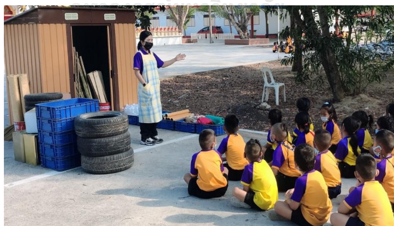
แผนภาพที่ 4 ครูกระตุ้นให้เด็กช่วยกันสร้างข้อตกลง