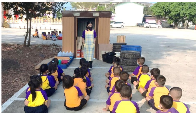
แผนภาพที่ 13 ครูและเด็กร่วมกันแลกเปลี่ยนความคิดเห็น