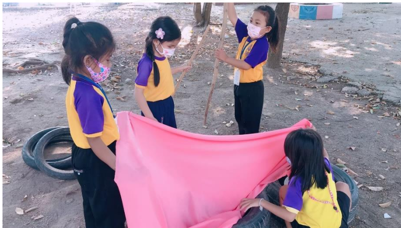
แผนภาพที่ 11 เด็กพบปัญหาว่าผ้ามีขนาดเล็กเกินไป จึงร่วมกันตัดสินใจในการเปลี่ยนอุปกรณ์จากผ้าเป็นผ้าใบ