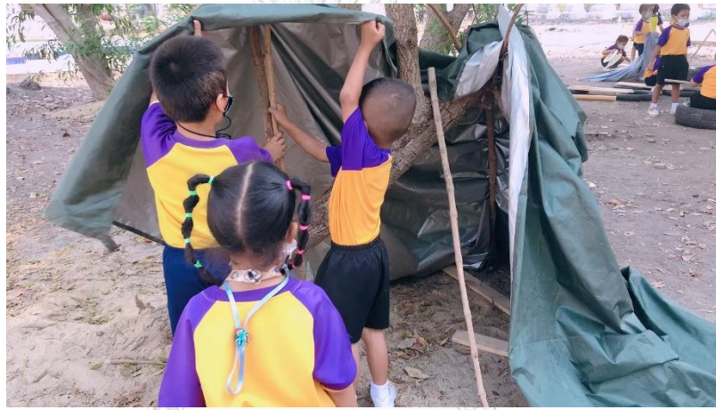
แผนภาพที่ 10 เด็กรับฟังความคิดเห็นของเพื่อนที่เพื่อนแนะนำว่าต้องใช้ไม้ค้ำ 2 อัน