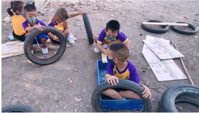
แผนภาพที่ 9 เด็กเจรจาต่อรองกับเพื่อนต่างกลุ่มในการผลิตกันเล่นผลงานของกันและกัน