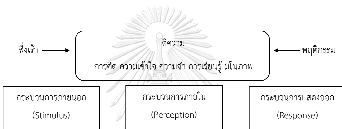
รูปภาพที่ 2.2 แบบจำลองกระบวนการรับรู้

สมภพ สุขกลัด (2543) กล่าวว่า กระบวนการรับรู้เป็นกระบวนการที่คาบเกี่ยวกันระหว่างความเข้าใจ ความรู้สึก ความจำ การเรียนรู้ การตัดสินใจ และการแสดงพฤติกรรม ดังภาพที่ 2.1 ดังนี้