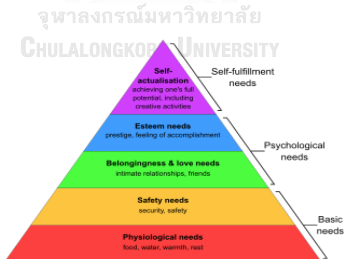
แผนภาพที่ 1 : ลำดับชั้นความต้องการของมาสโลว์

อย่างไรก็ตามการจะบรรลุถึงความภาคภูมิใจตามแนวคิดของมาสโลว์ ได้นั้นจำเป็นที่จะต้องผ่านการบรรลุตามลำดับชั้นก่อนหน้าดังกล่าวก่อน กล่าวคือ บุคคลต้องได้รับการตอบสนองต่อปัจจัยในการดำรงชีวิต เช่น อาหาร น้ำ ที่อยู่อาศัย ยารักษาโรค รวมถึงมีไ่ว่างใจต่อความปลอดภัยในชีวิต และทรัพย์สินของตน อีกทั้งต้องได้รับการยอมรับเป็นส่วนหนึ่งของสังคมตั้งแต่ระดับครอบครัว องค์กร ชุมชน