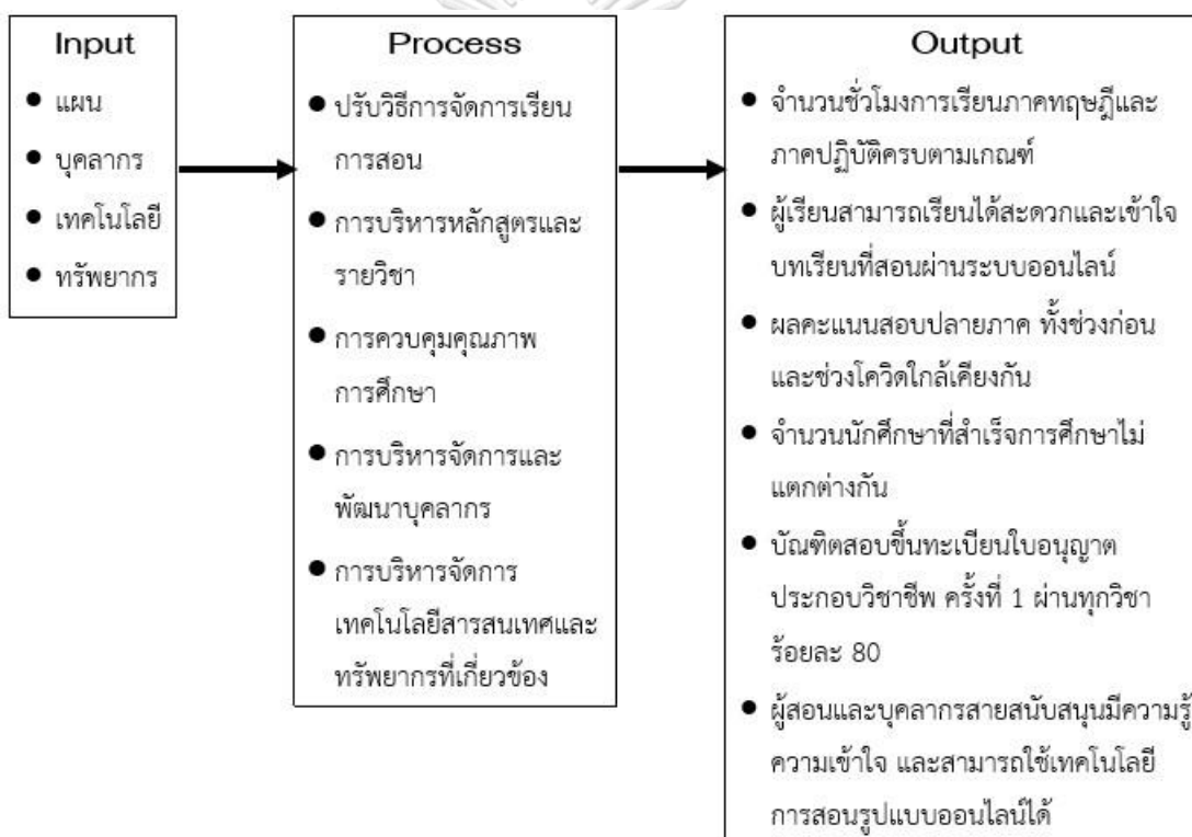
รูปที่ 2 กรอบแนวคิดการศึกษา

จากการค้นคว้าและทบทวนแนวคิด ทฤษฎี เอกสาร และงานวิจัยที่เกี่ยวข้อง ผู้วิจัยได้กำหนดกรอบแนวคิดการศึกษาการบริหารจัดการศึกษาของสำนักวิชาพยาบาลศาสตร์ สถาบันการพยาบาลศรีสวรินทิรา สภากาชาดไทย ในยุคปกติใหม่ โดยมีการศึกษาถึงการวางแผนการบริหารจัดการศึกษา การบริหารหลักสูตรและรายวิชา การควบคุมคุณภาพการศึกษา การบริหารจัดการบุคลากร รวมถึงการบริหารจัดการด้านเทคโนโลยีสารสนเทศในการเรียนการสอน และทรัพยากรที่เกี่ยวข้อง เพื่อให้สามารถจัดการเรียนการสอนในสถานการณ์การแพร่ระบาดของเชื้อไวรัสโควิด-19 ได้อย่างต่อเนื่องและมีประสิทธิภาพ ซึ่งสามารถสรุปเป็นกรอบแนวคิดได้ดังภาพต่อไปนี้