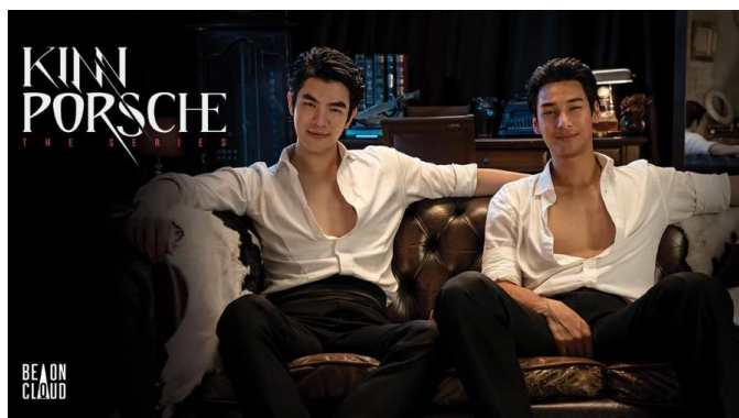
ภาพที่ 1 ซีรีส์วาย เรื่อง คินน์ พอร์ช เดอะซีรีส์ รักโคตรร้าย สุดท้ายโคตรรัก (KinnPorsche The Series)

เกี่ยวข้อง โดยเฉพาะการกล่าวถึงและการถกเถียงของผู้ชมในเรื่องความหลากหลายและความเท่าเทียมทางเพศของตัวละคร ซึ่งได้สร้างความน่าสนใจให้กับผู้วิจัยอย่างมาก