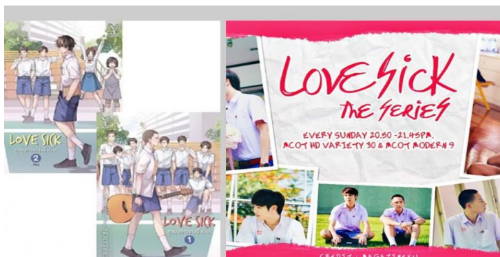
ภาพที่ 2 ซีรีส์ เรื่อง Love Sick the Series (รักวุ่น วัยรุ่นแสบ)