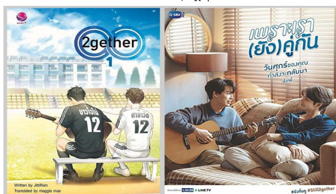
ภาพที่ 3 ซีรีส์ เรื่อง เพราะเราคู่กัน (2gether the Series)