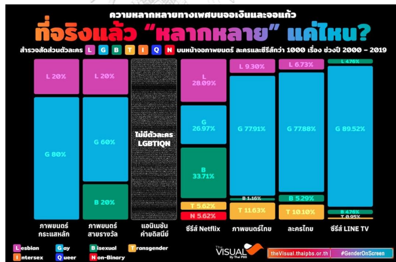
ภาพที่ 5 ความหลากหลายทางเพศบนสื่อไทย

อย่างไรก็ดี ณ ปัจจุบันนี้ ในยุคที่การพูดคุยเรื่องความเสมอภาคทางเพศเกิดขึ้นอย่างกว้างขวาง และมีรายละเอียดแตกแขนงย่อยออกไปหลายมิติ มีการตั้งข้อสังเกตเกี่ยวกับสื่อบันเทิงทั้งจากนักวิจารณ์และผู้ชมว่า เมื่อพิจารณากันอย่างถี่ถ้วนแล้วความหลากหลายทางเพศบนจอภาพยนตร์ ละคร และซีรีส์นั้น “หลากหลาย” ดังแสดงในภาพที่ 5 (The Visual by Thai PBS, 2564)